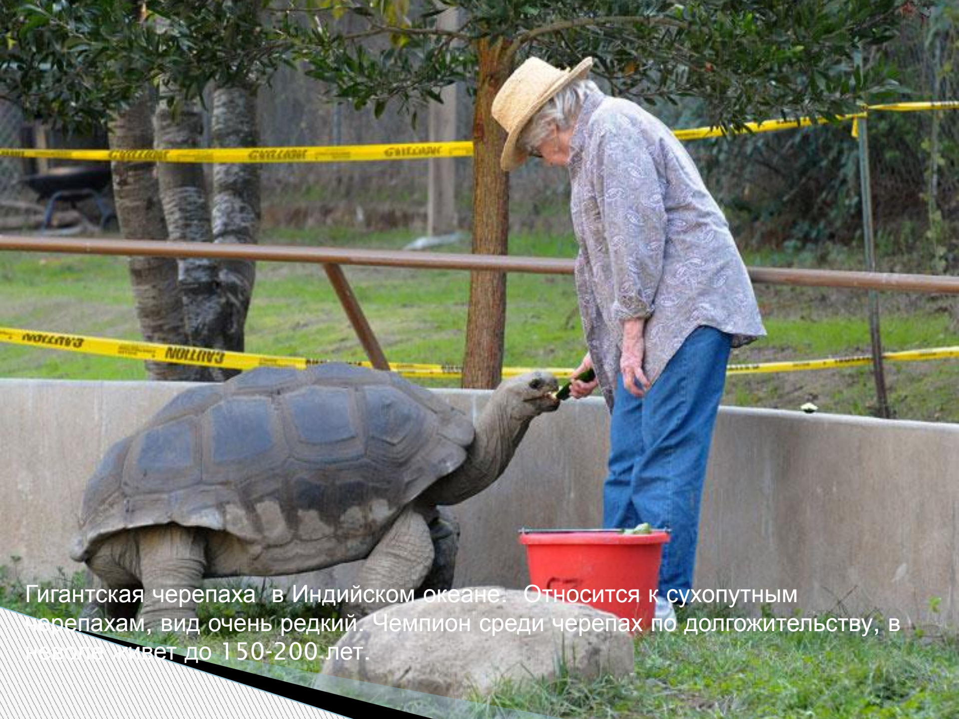
Гигантская черепаха в Индийском океане. Относится к сухопутным черепахам, вид очень редкий. Чемпион среди черепах по долгожительству, в неволе живет до 150-200 лет.