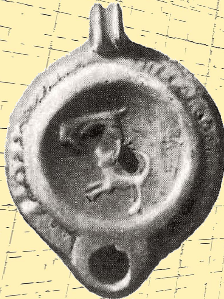
Древний светильник на оливковом масле