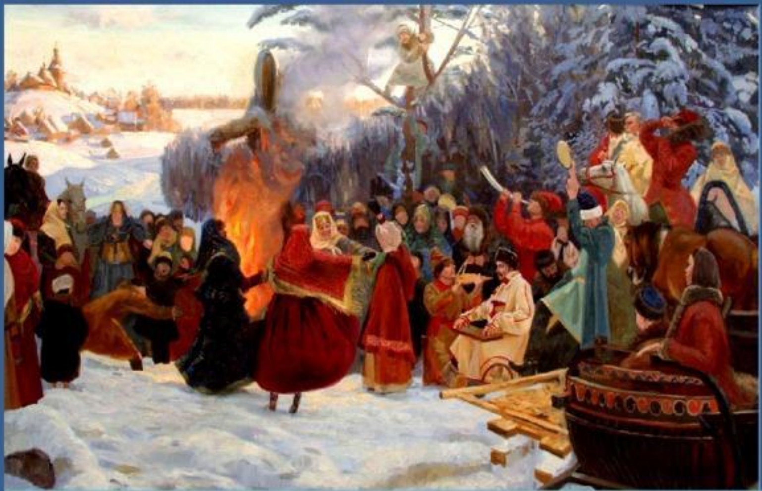
Семён Леонидович Кожин "Масленица. Проводы. Россия 17 век»