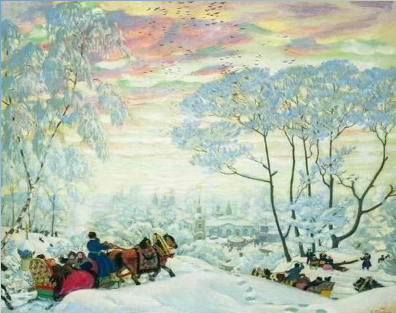
«Зима», 1916 г.