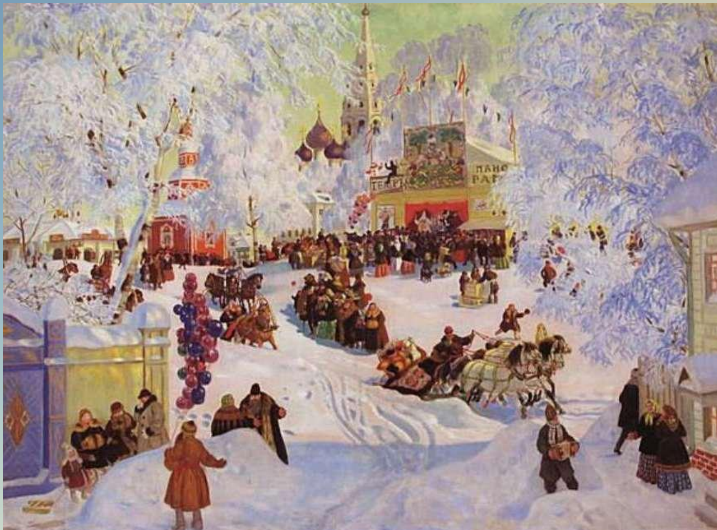
«Масленица», 1919 г.