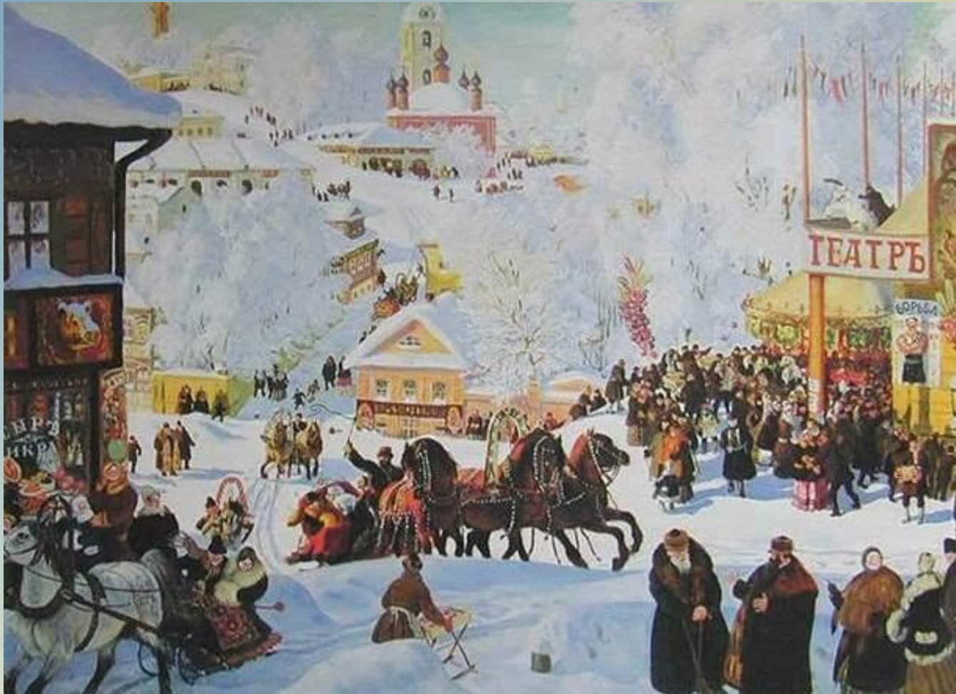
«Масленица», 1916 г.