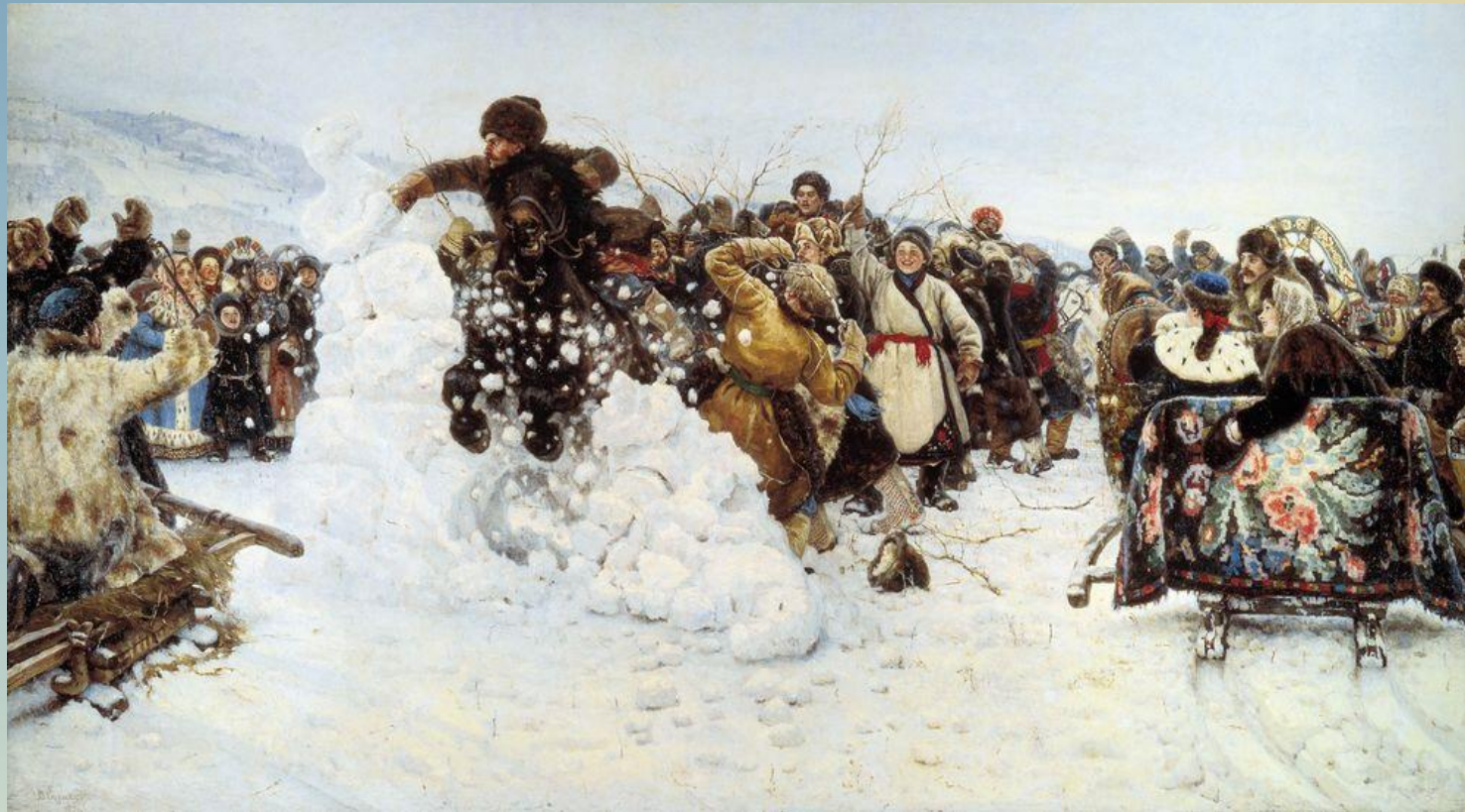
В.И. Суриков, «Взятие снежного города» (1891 г.)

Масленица — известный веселый праздник русских людей, который сохранился с языческих времен. Множество художников остановили свое внимание на таких гуляниях и изобразили на своих картинах этот праздник.