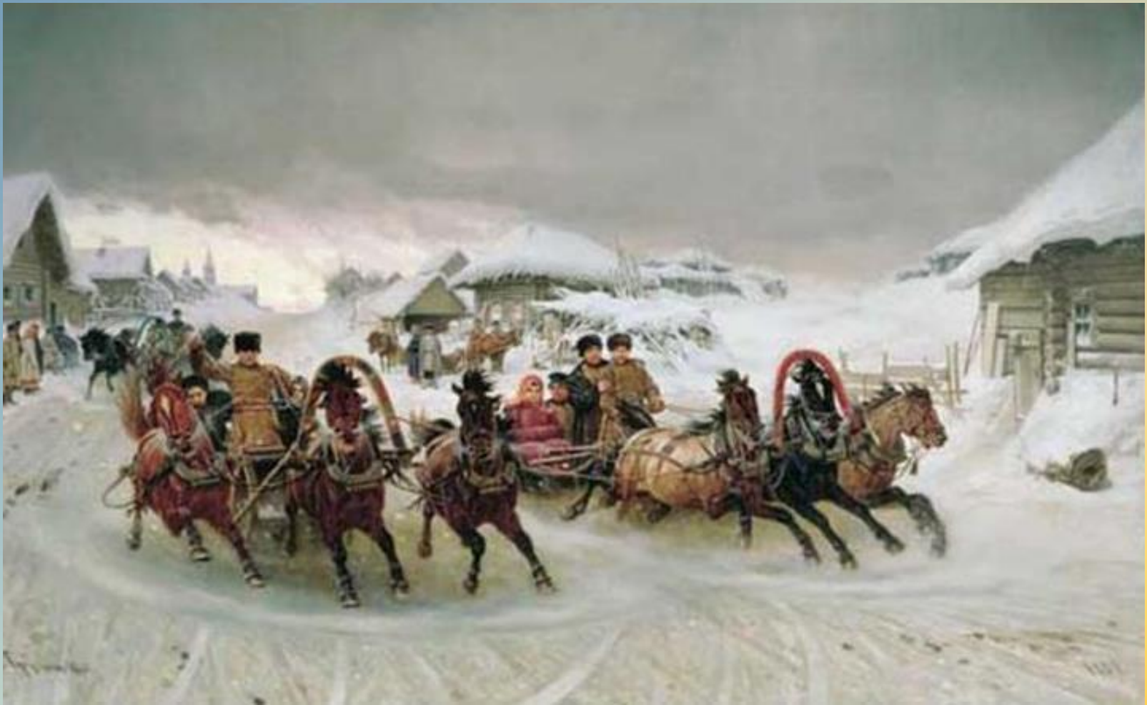
Петр Николаевич Грузинский «Масленица», 1889 г.