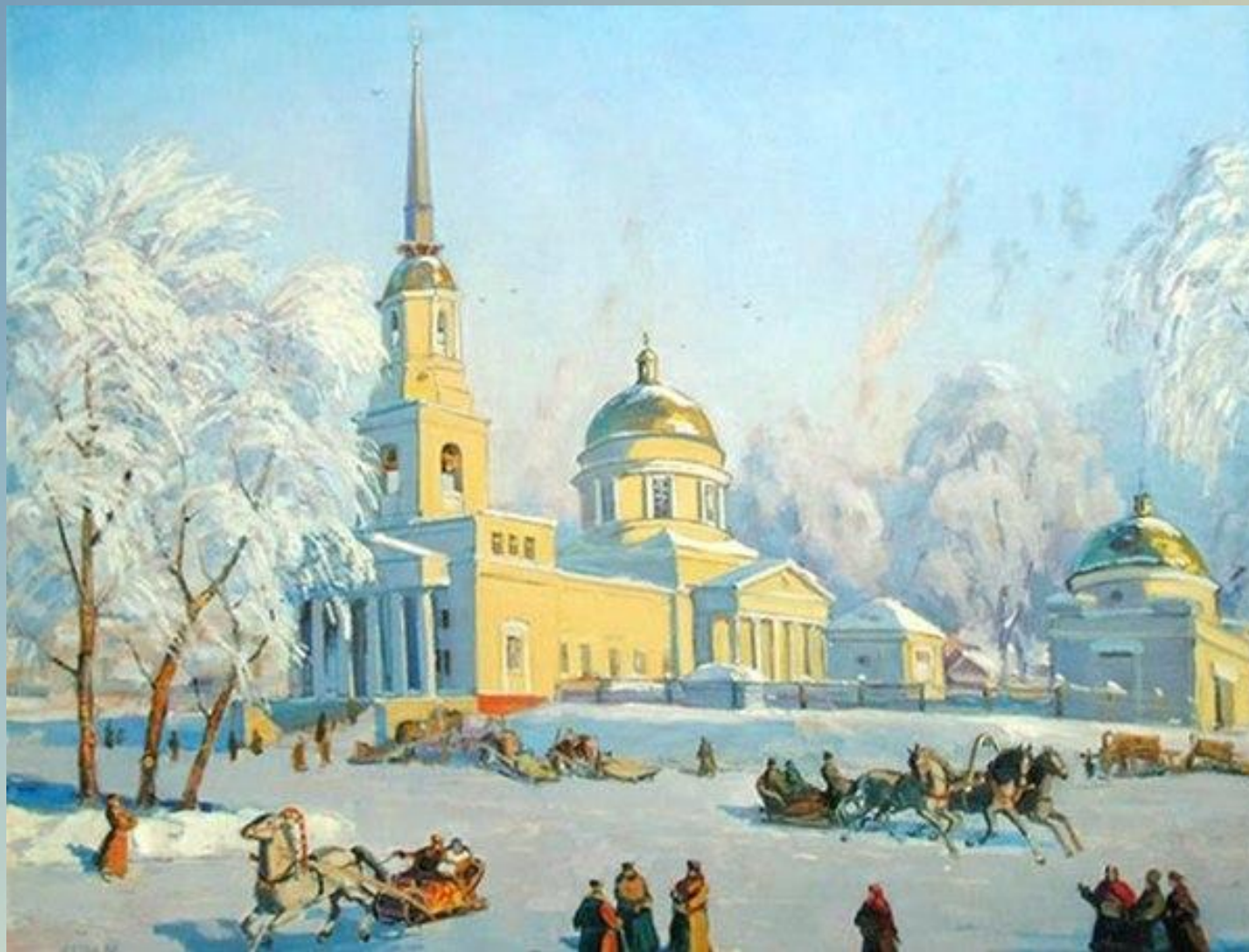
Валентин Белых «Собор Александра Невского Масленица», 1908 г.