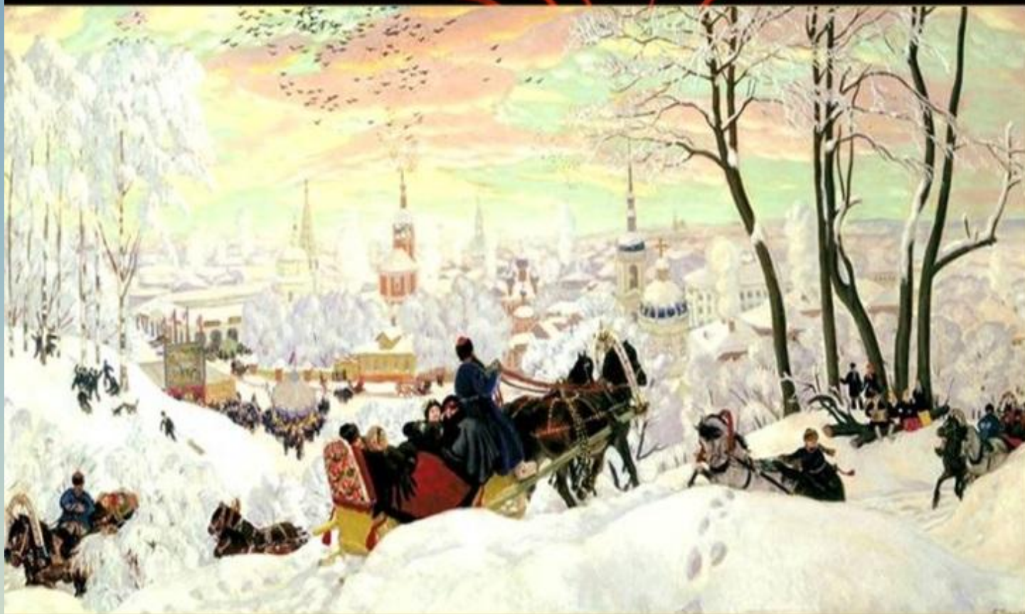
Б. М. Кустодиев. «Масленица» 1903