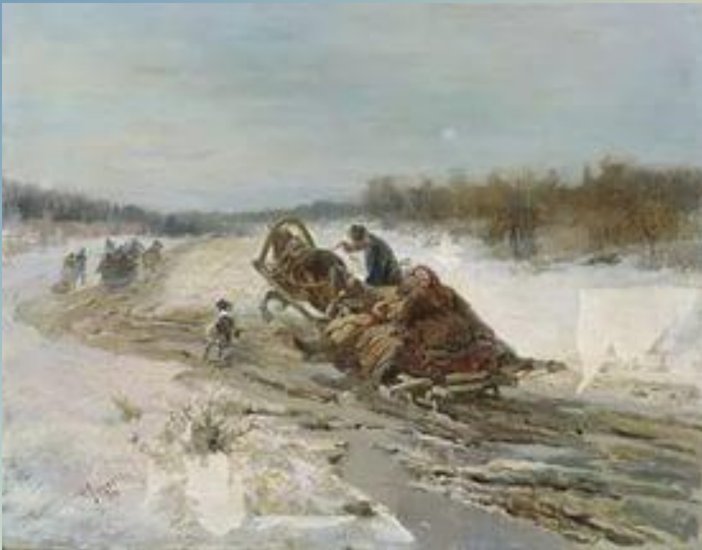
Рудольф Френц «Масленица», 1903 г.