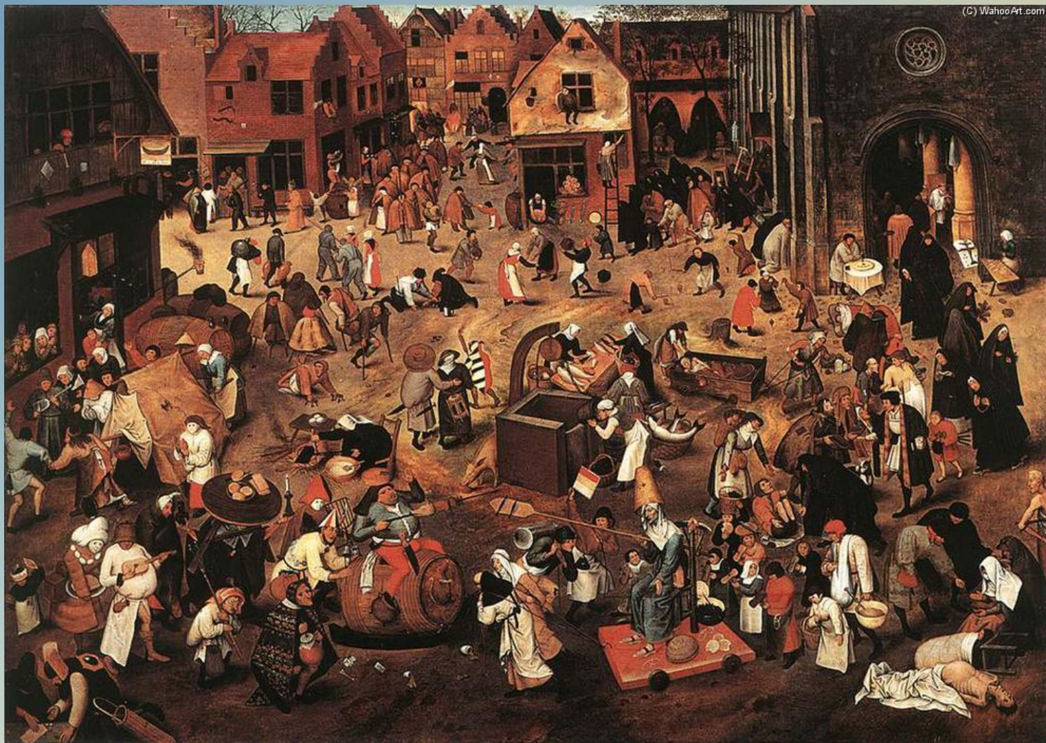
Питер Брейгель, «Битва Масленицы и Поста» 1559 г.