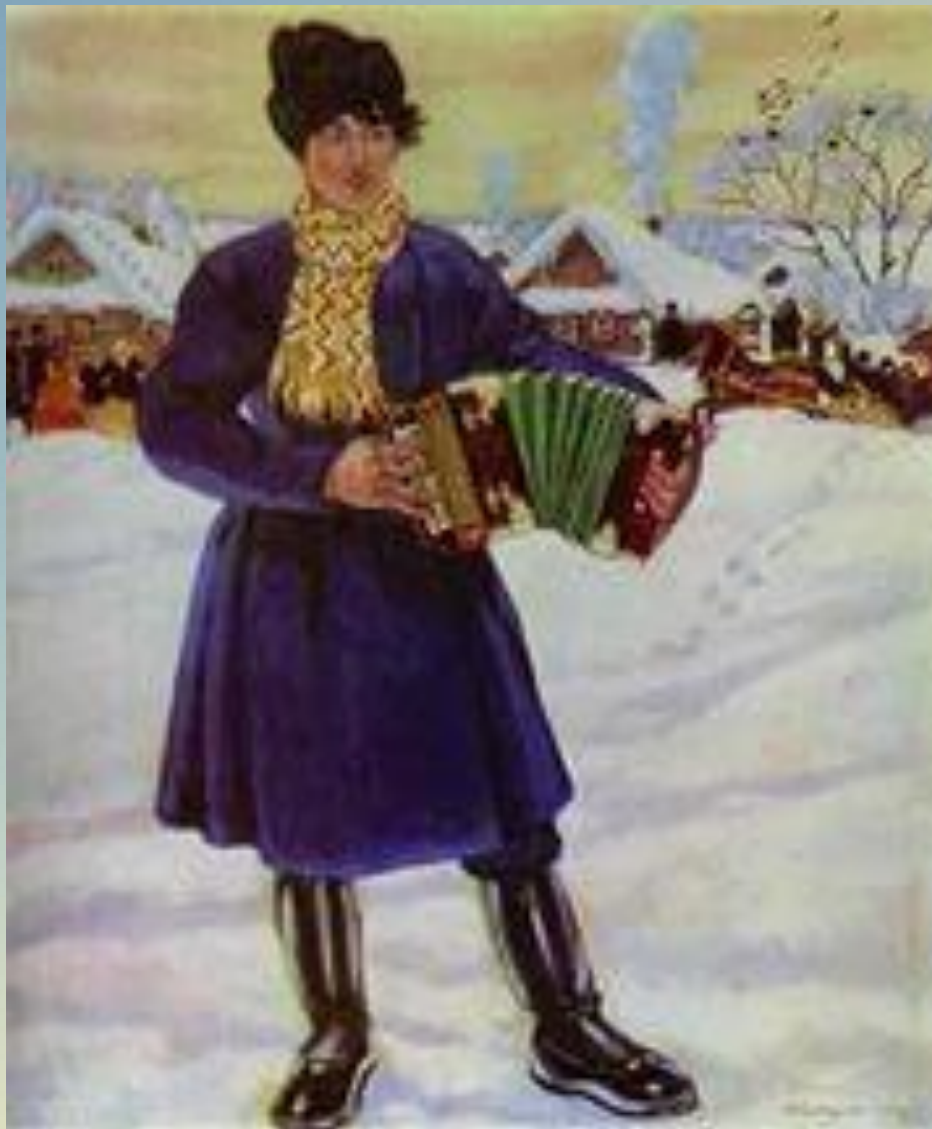
«Деревенская масленица» (Гармонист), 1916 г.