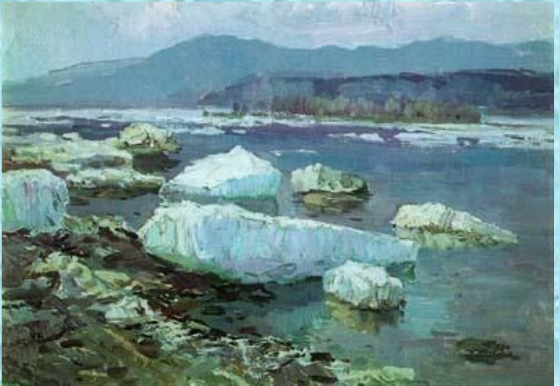
Н.В. Ряннель «Ледоход»