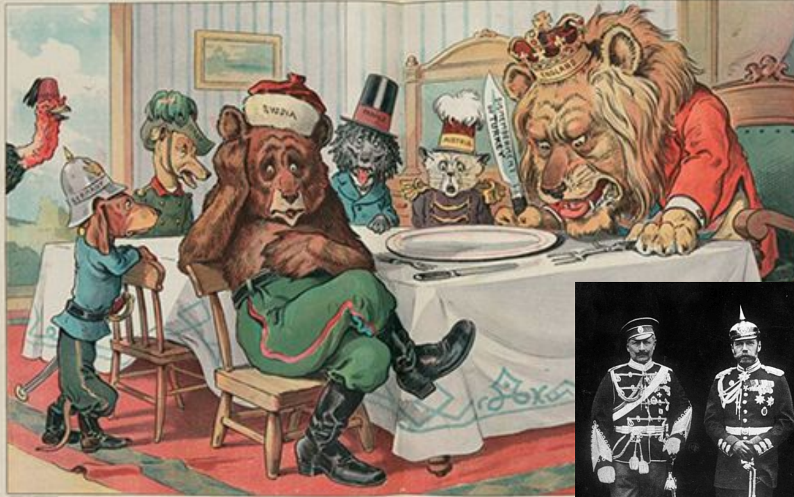
Два императора Николай II (справа) и Вильгельм II (слева)