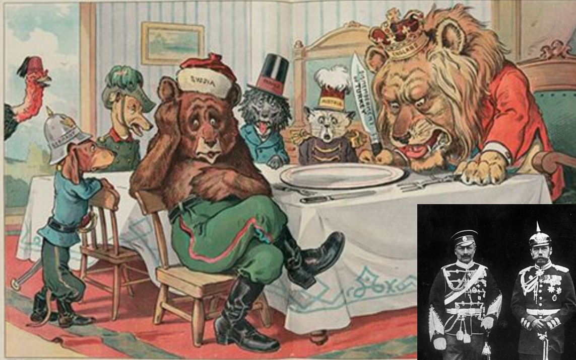
Два императора Николай II (справа) и Вильгельм II