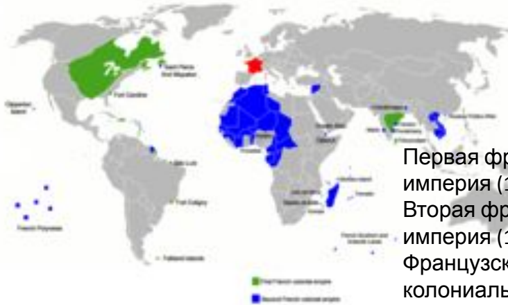
Первая французская империя (1804—1815) Вторая французская империя (1853—1871) Французская колониальная империя (ок. 1605—1960-е)