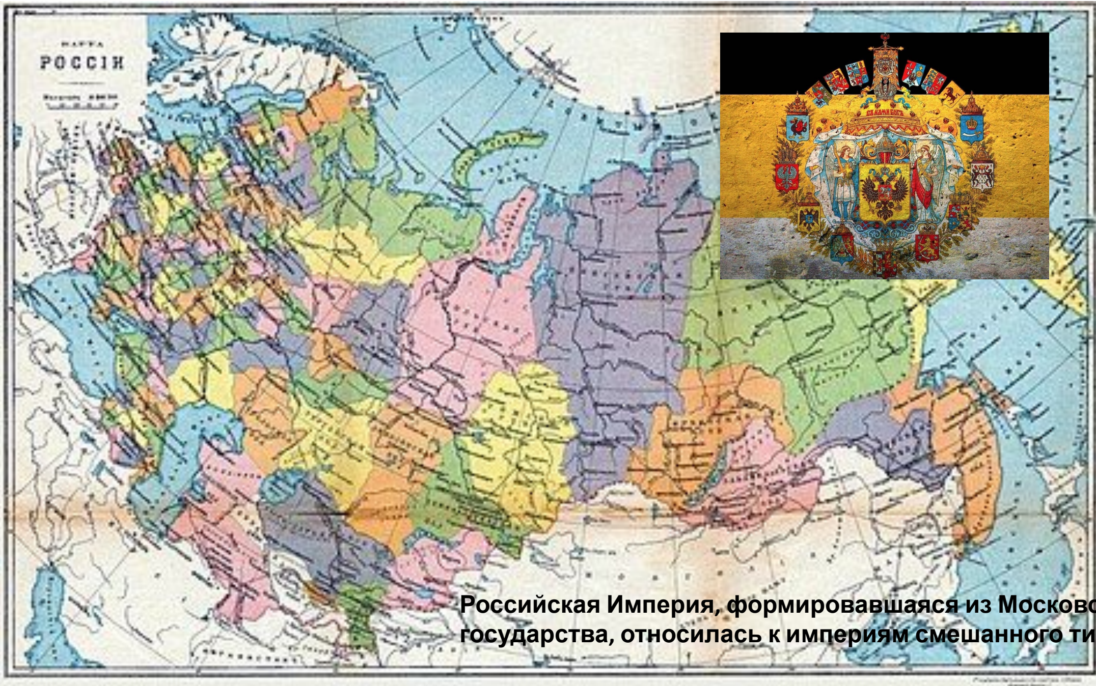
Российская Империя, формировавшаяся из Московского государства, относилась к империям смешанного типа