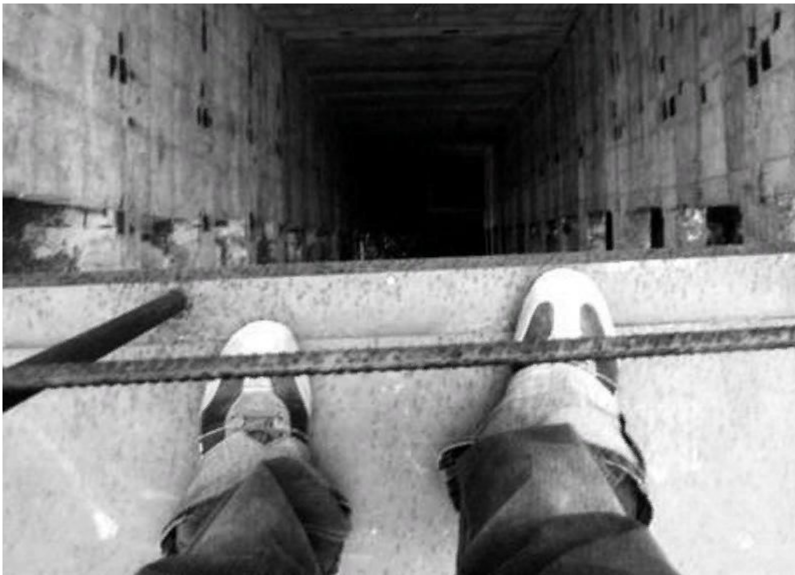
Рис.9. скрытый суицид