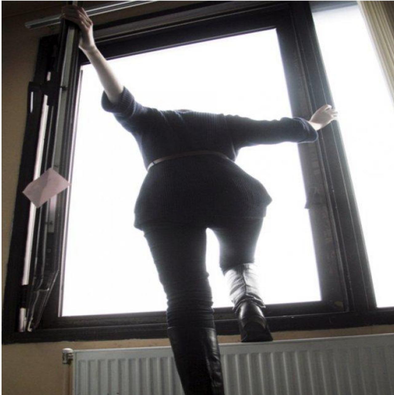
Рис.3. истинный суицид