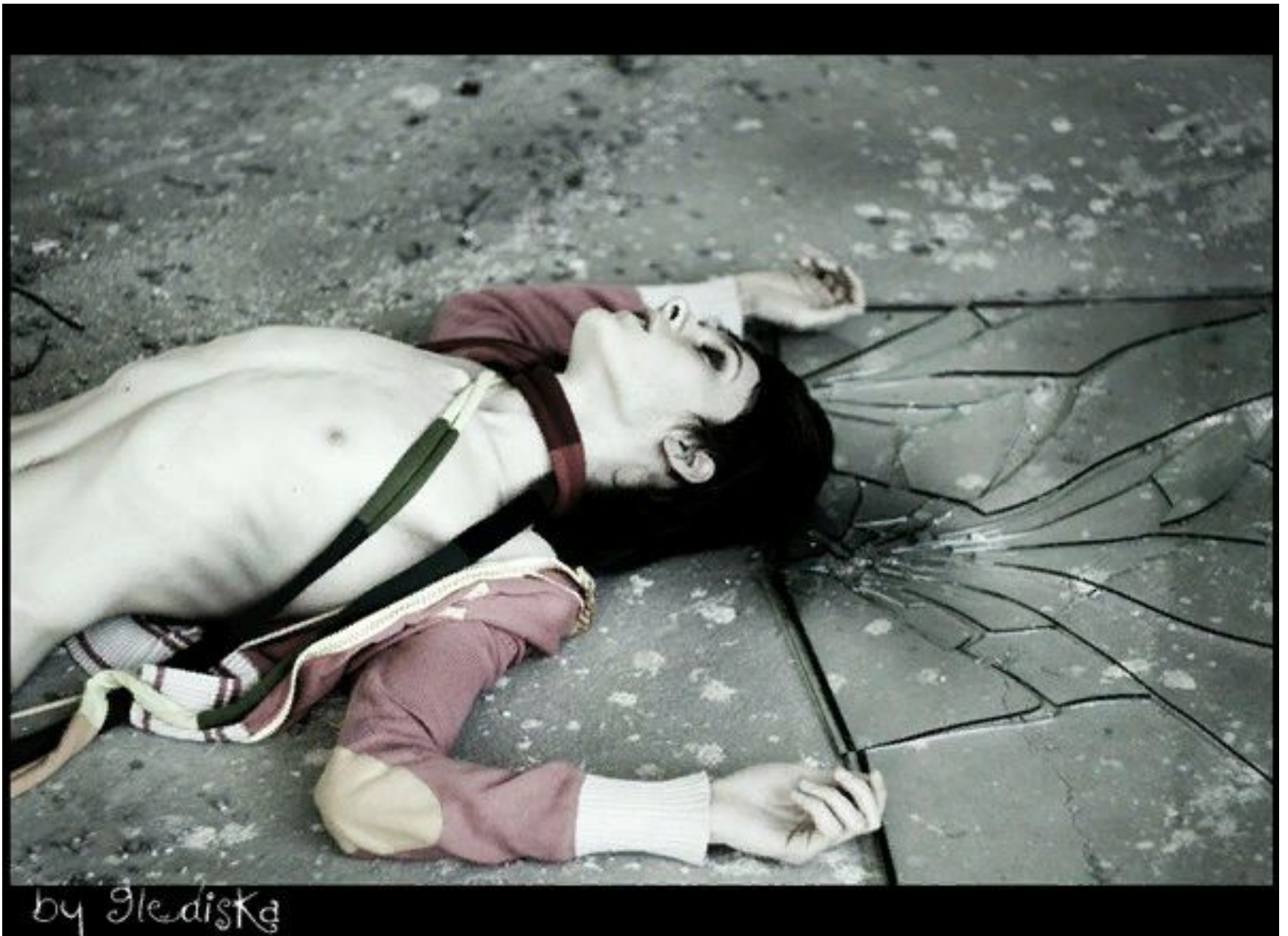
Рис.4. истинный суицид