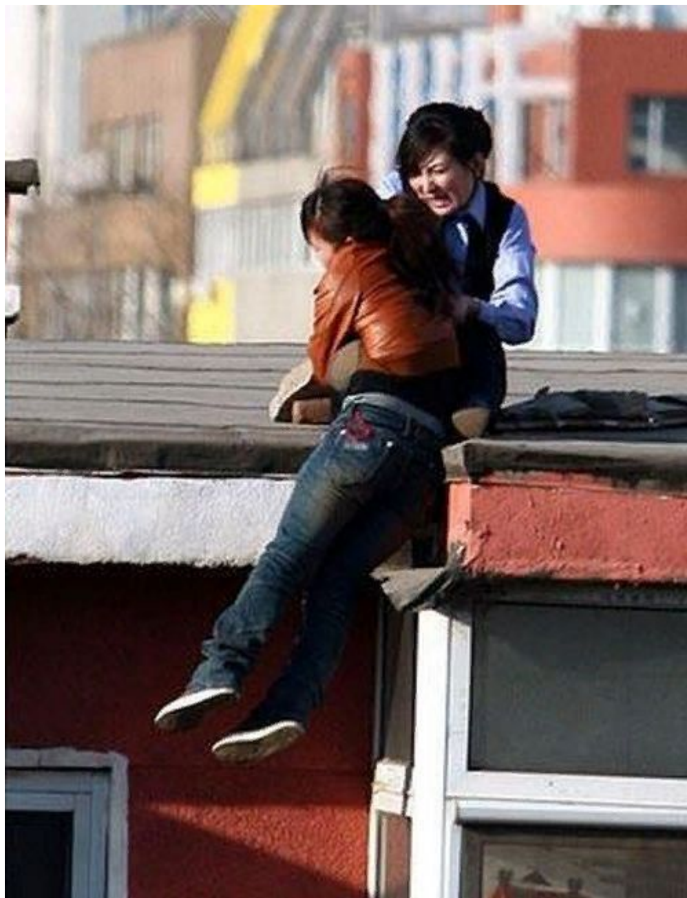
Рис.6. демонстративный суицид