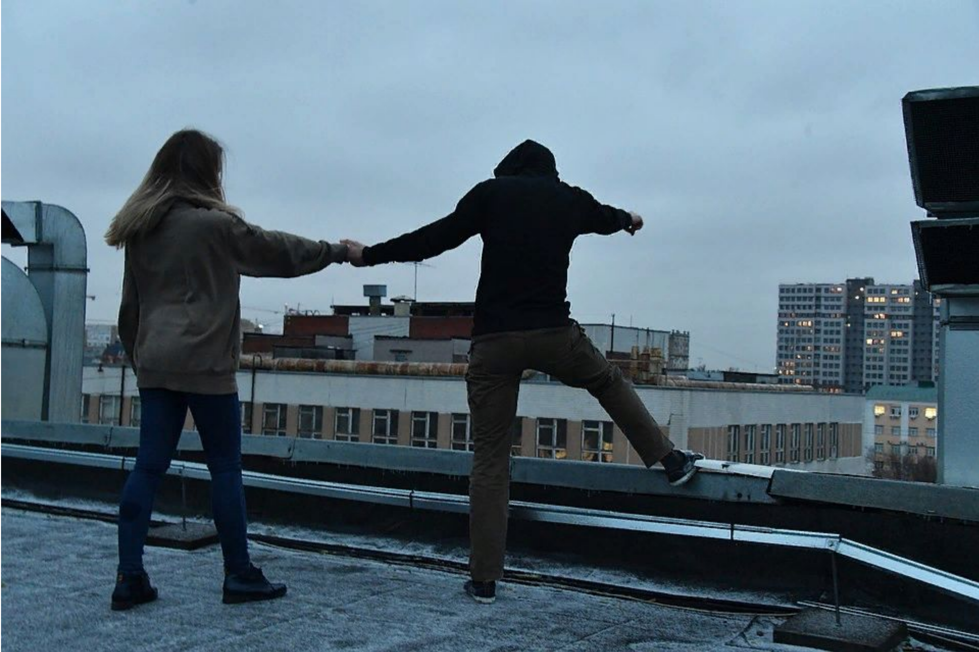
Рис.5. демонстративный суицид