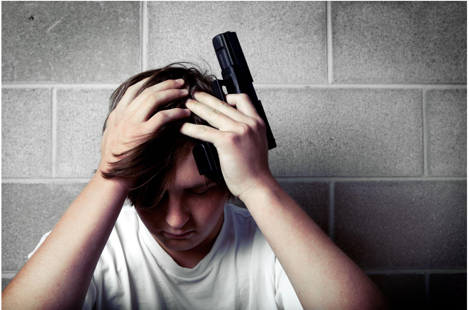
Рис.10. скрытый суицид