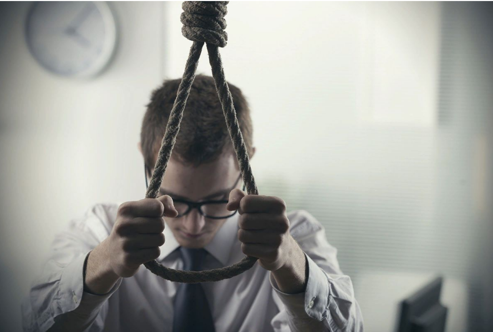
Рис.2. истинный суицид