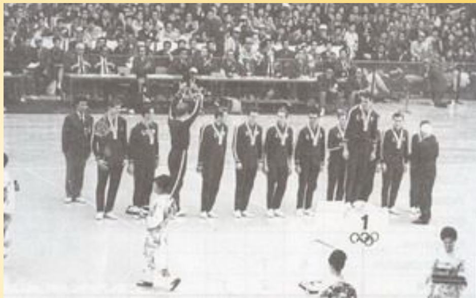
Сборная СССР - чемпион Олимпиады 1964

В Германии соревнования по волейболу были названы так: "Волейбол - традиционная русская игра".