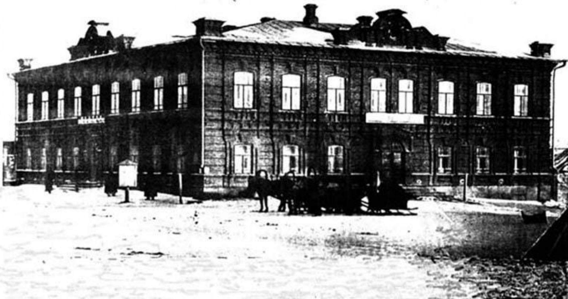
Новое здание Первого Николаевского приходского училища (1900 год)/ Будущий Лицей № 13