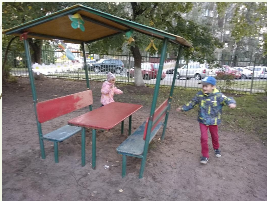
Подвижная игра «Догонялки»