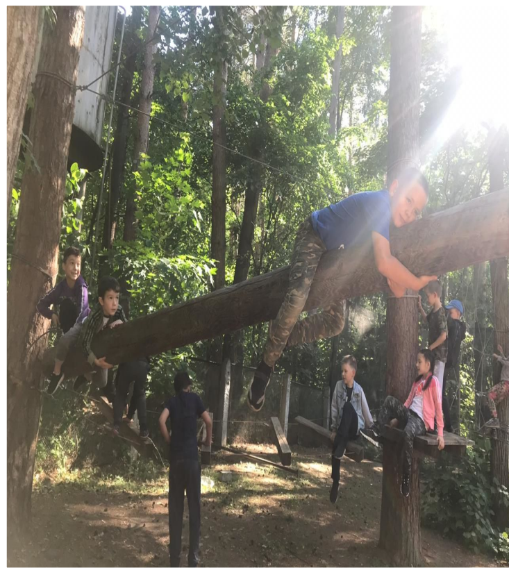
ПОХОД В КЛУБ «СТРЕЛОК»