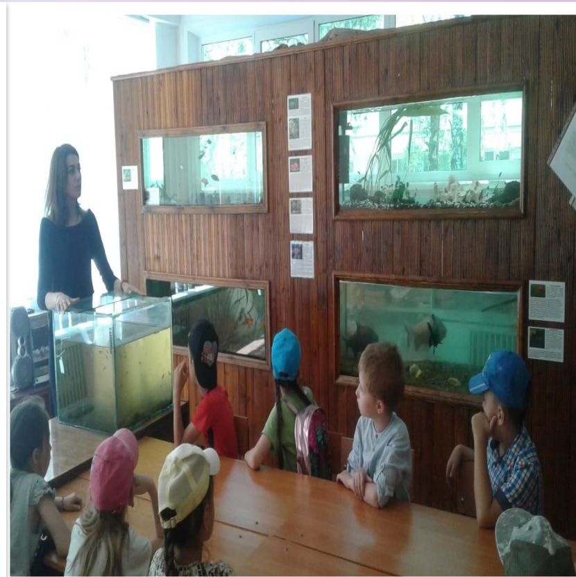
ПОСЕЩЕНИЕ ЭКОЛОГО- БИОЛОГИЧЕСКОГО ЦЕНТРА.