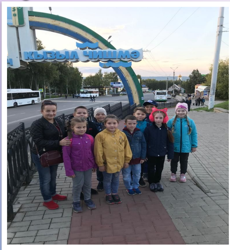
ЭКОЛОГИЧЕСКАЯ ЭКСКУРСИЯ В ПОСЕЛОК КРАСНЫЙ КЛЮЧ