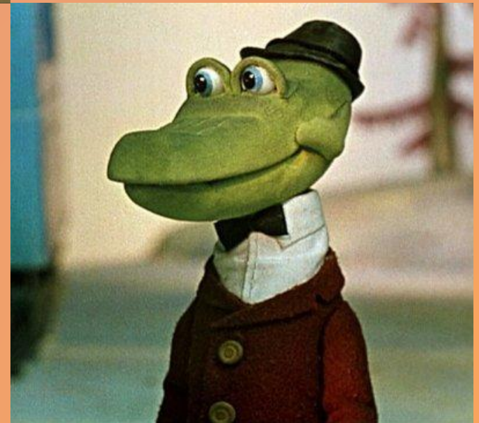
Крокодил Гена крокодил Гена