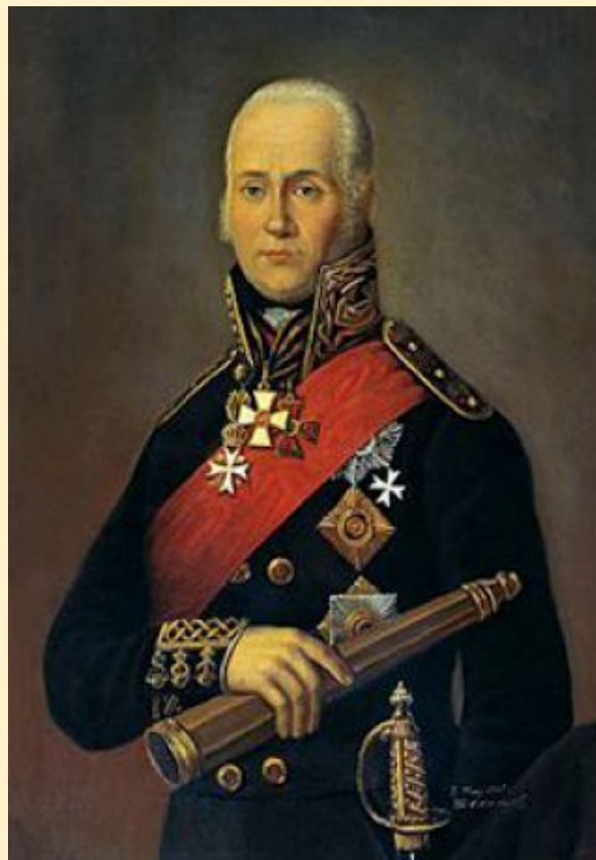
Фёдор Фёдорович Ушаков (1745 – 1817 гг.) Русский флотоводец