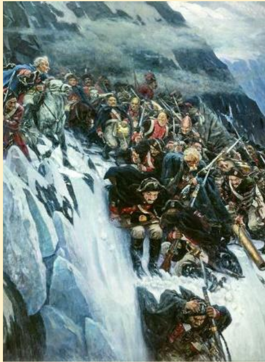
«Переход Суворова через Альпы» — картина Василия Сурикова