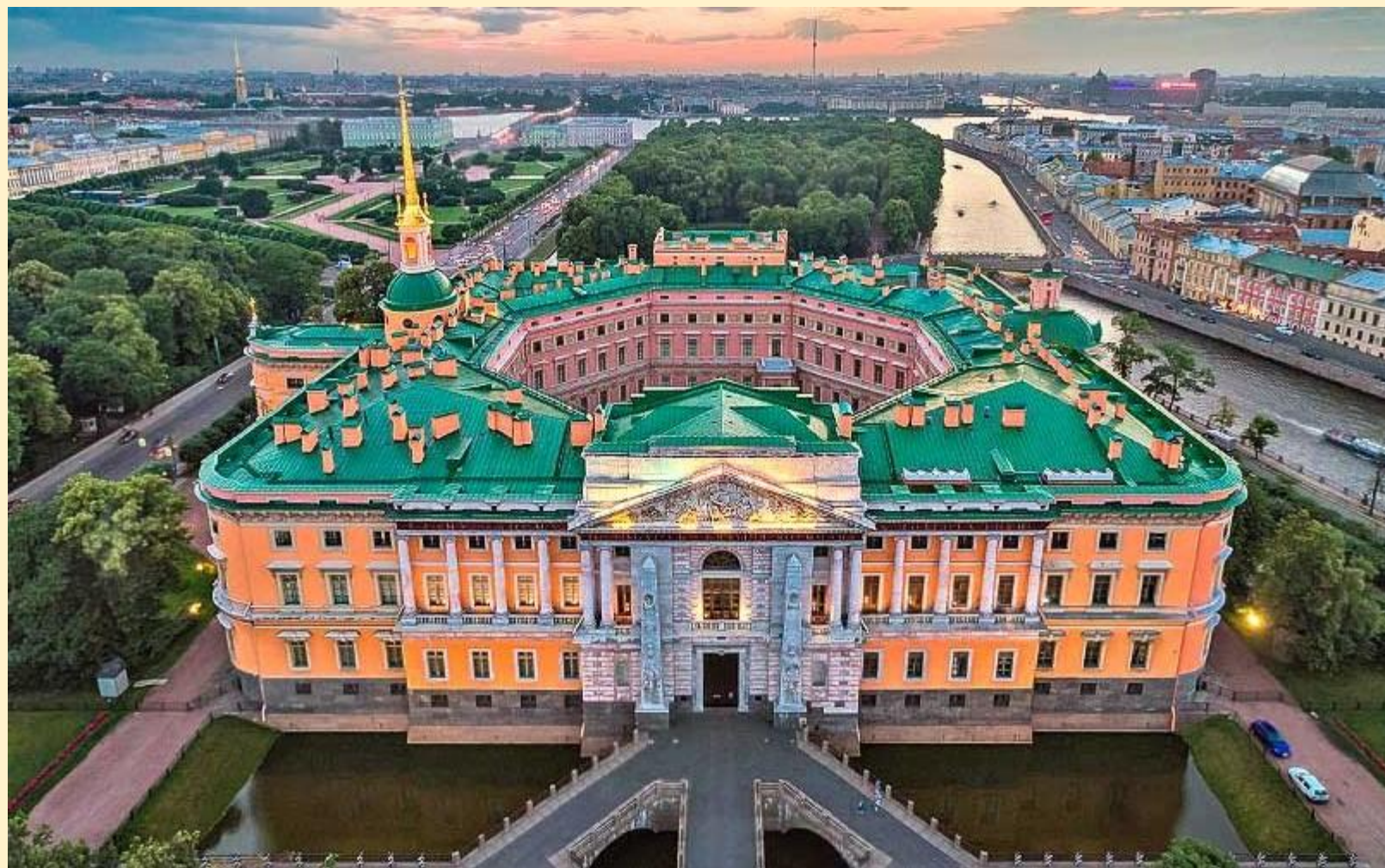
Миха́йловский, или Инженерный за́мок