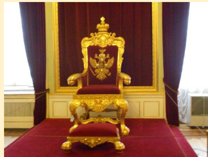
Трон Павла I

Указ действовал до падения самодержавия!