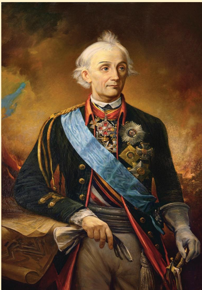
Александр Васильевич Суворов (1730 – 1800 гг.) Русский полководец