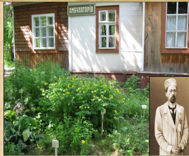
Амбулатория, где Чехов-врач принимал больных.