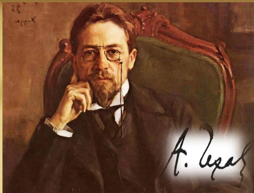
АНТОН ПАВЛОВИЧ ЧЕХОВ (1860 – 1904 г.г)