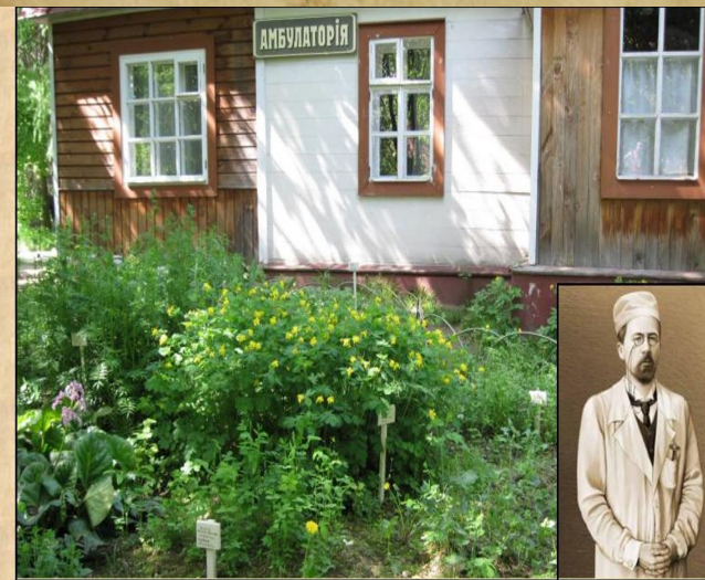
Амбулатория, где Чехов-врач принимал больных.