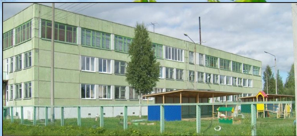
Детский сад «Журавушка»