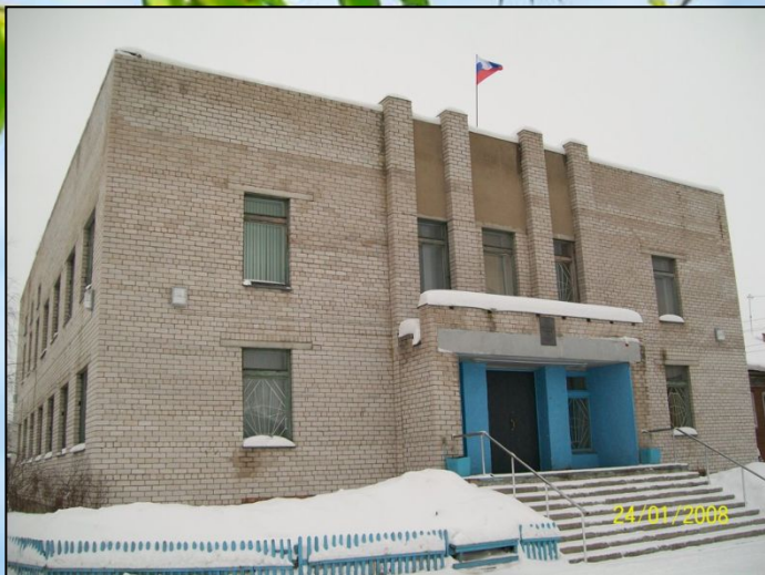
Здание районного суда