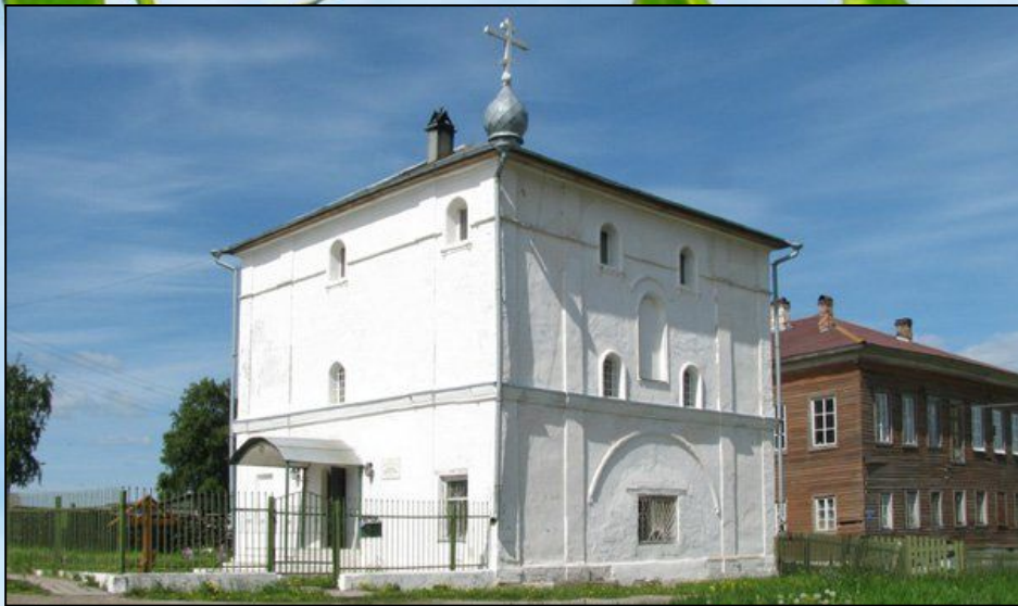
Спасо – преображенский собор