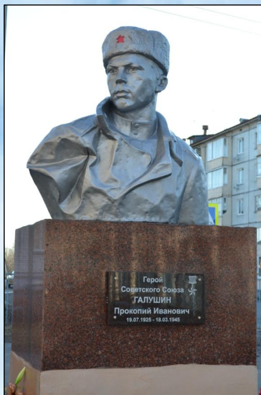
Памятник Галушину Прокопию Ивановичу