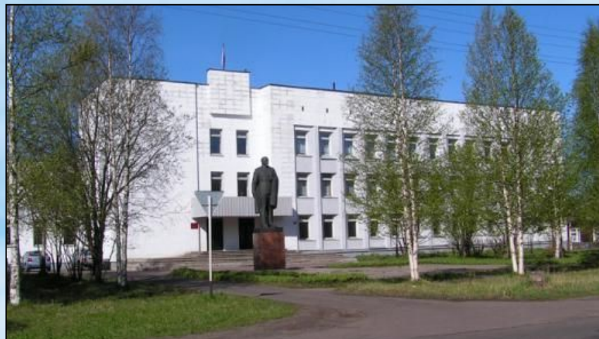
Здание районной администрации