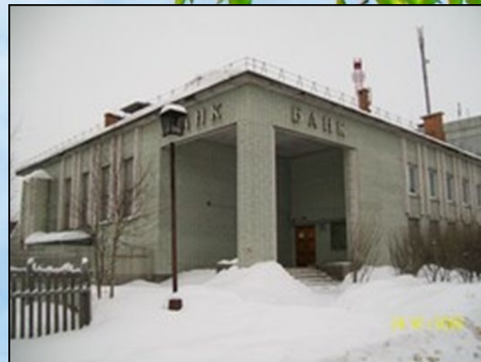
Россельхоз банк, магазин