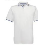
3740-1/2 Белый/Ярко-синий White/Royal blue