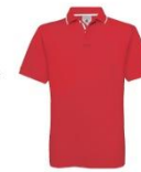
3740-4/1 Красный/Белый Red/White