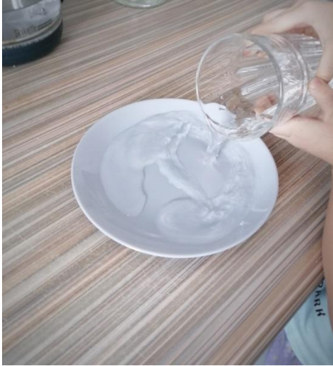
Вода рек и озёр, дождь и т.д.