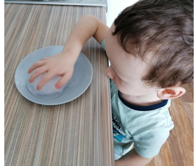
Снег, град, лёд и т.д.

Вывод: состояние воды зависит от температуры окружающей среды.