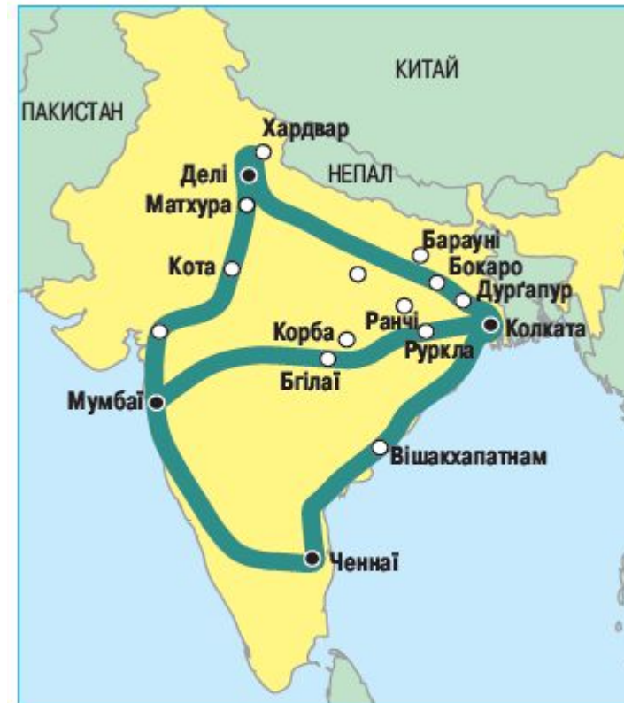
«Коридори зростання» Індії

Основні центри промислового виробництва з'єднано транспортною інфраструктурою, уздовж якої склалися т. зв. коридори зростання. Вони являють собою ряд промислових центрів, формування яких пов'язано з транспортним або сировинним чинниками. Зростає значення міста Бангалор як осередку високотехнологічних виробництв.