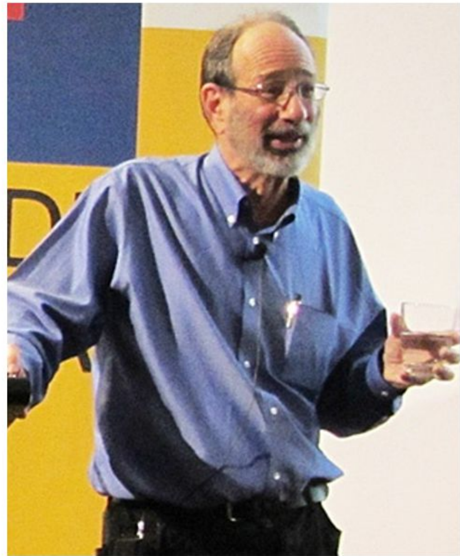
Элвин Элиот Рот