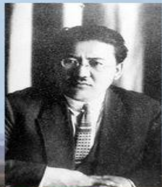
Зам. Председателя Совнаркома РСФСР Т.Рыскулов