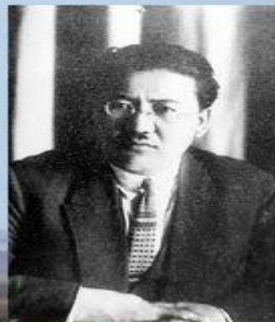
Зам. Председателя Совнаркома РСФСР Т.Рыскулов