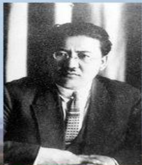
Зам. Председателя Совнаркома РСФСР Т.Рыскулов