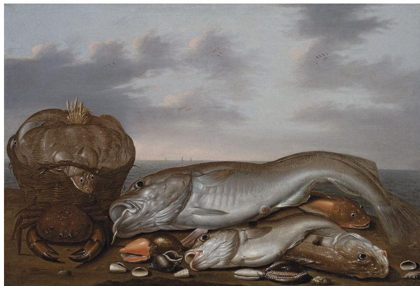
Виллем Ормеа. «Натюрморт с камбалой в корзине, треской, крабом и ракушками». 1646