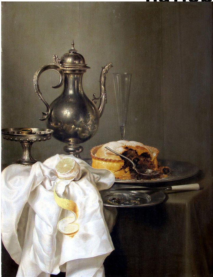
Виллем Клас Хеда. «Натюрморт с серебряным кувшином и пирогом». 1645