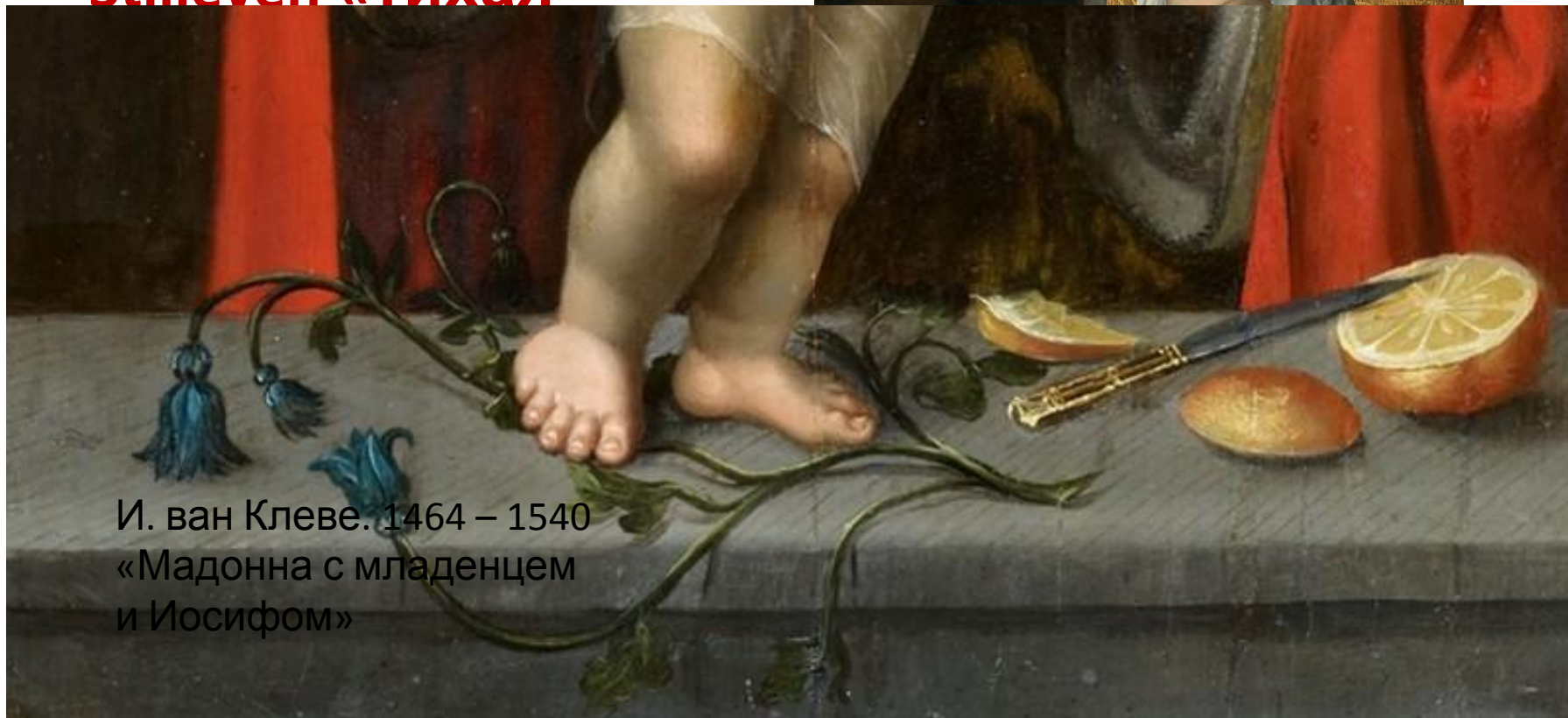
И. ван Клеве. 1464 – 1540 «Мадонна с младенцем и Иосифом»