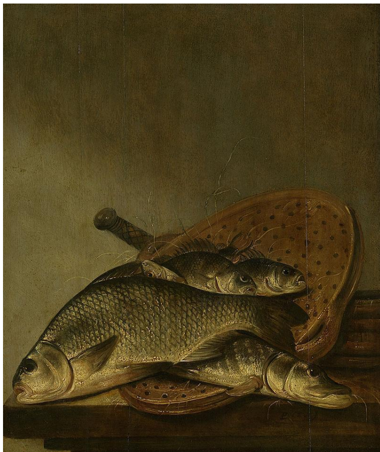
Питер де Пюттер. «Натюрморт с рыбами». 1630—1659