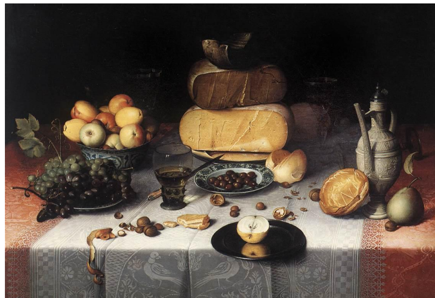
Николас Гиллис. «Накрытый стол». 1611