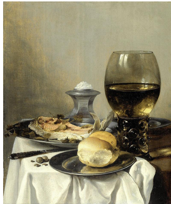
Питер Клас. «Натюрморт с солонкой». Ок. 1644