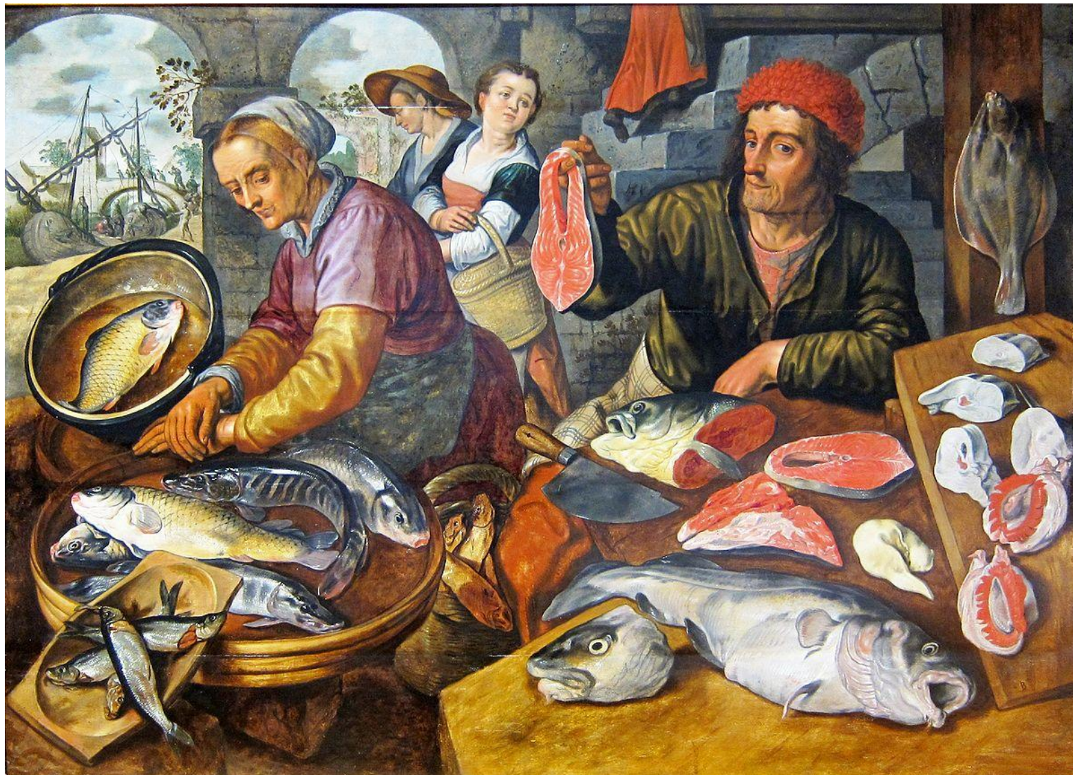
Иоахим Бейкелар "Торговцы рыбой".