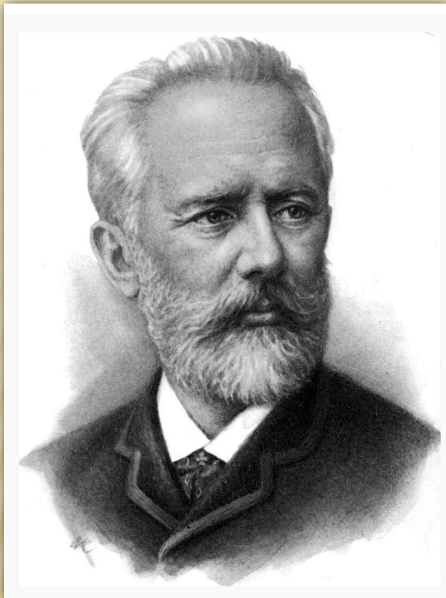
Петр Ильич Чайковский (1840-1893)