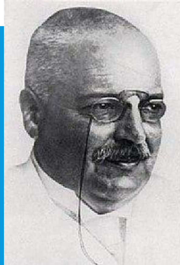
Алоис Альцгеймер немецкий психиатр и невролог

Деменция* — приобретённое слабоумие, стойкое снижение познавательной деятельности с утратой в той или иной степени ранее усвоенных знаний и практических навыков и затруднением или невозможностью приобретения новых.