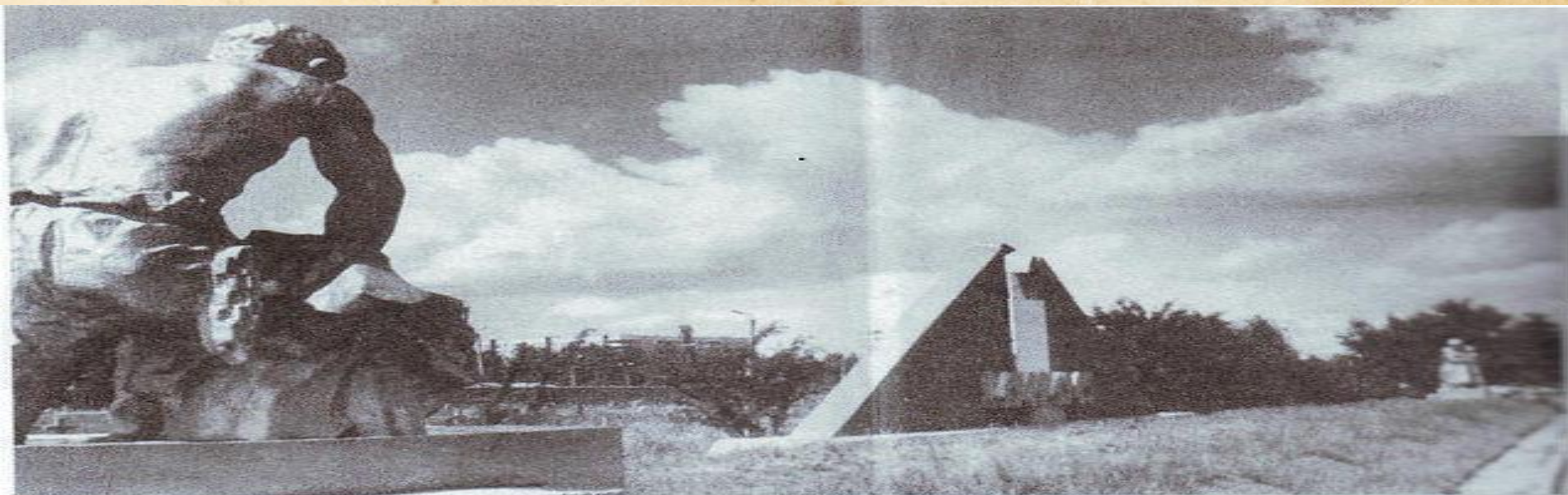
Братская могила воинов, умерших от ран в госпиталях г. Абакана в годы Великой Отечественной войны