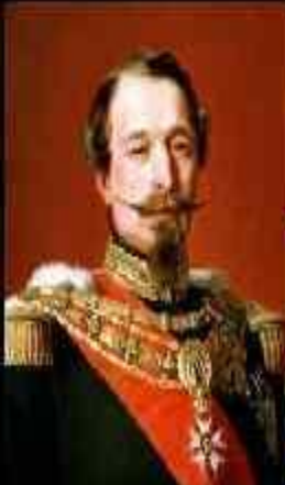
Луи Наполеон III Император Франции 1852-1870