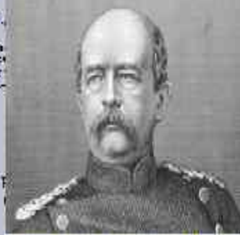
Отто фон Бисмарк (1815-1898) министр-президент Пруссии 1862-1890 канцлер Северогерманского союза