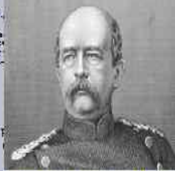
Отто фон Бисмарк (1815-1898) министр-президент Пруссии 1862-1890 канцлер Северо-германского союза