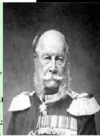
Вильгельм I (1797-1888) Король Пруссии 2 января 1861 — 9 марта 1888