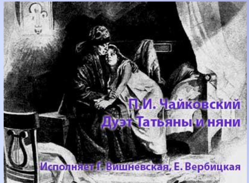
П. И. Чайковский Дуэт Татьяны и няни