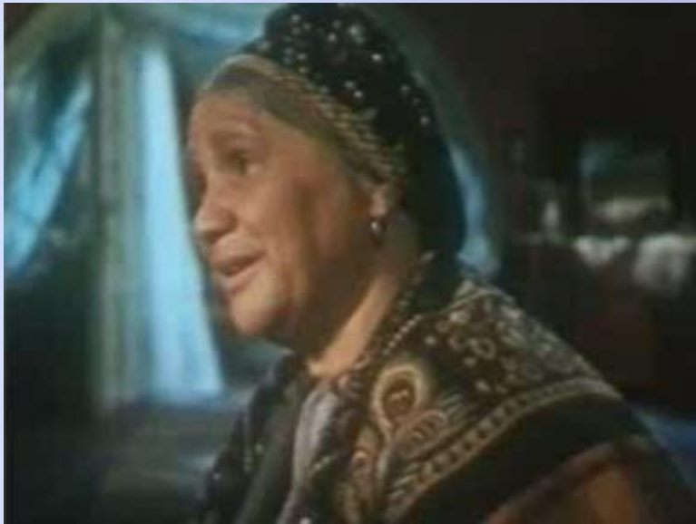
Ария няни Татьяны из оперы П. И. Чайковского «Евгений Онегин»