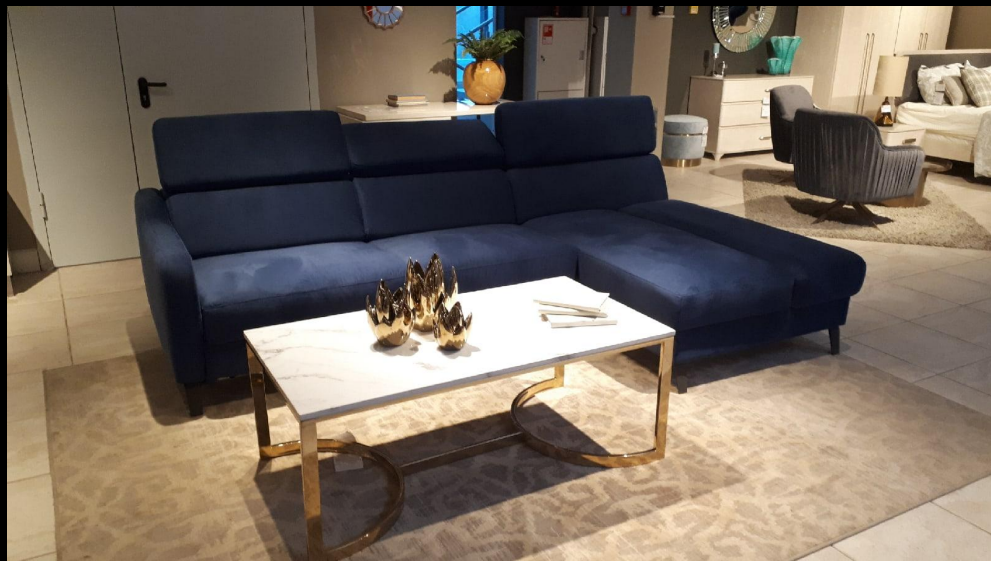
O`PRIME ДИВАН УГЛОВОЙ VITO ПРАВЫЙ ТКАНЬ AUSTIN-08