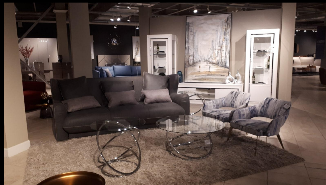
O`PRIME ДИВАН МОДУЛЬНЫЙ PAUL A2Л+A6П ТЭСС-01/R-130(С) СЕРАЯ