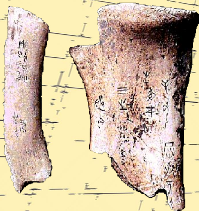
Письмо на костях