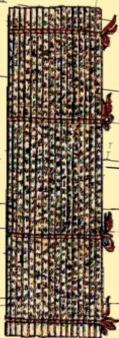
Письмо на бамбуковых дощечках