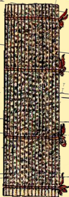
Письмо на бамбуковых дощечках