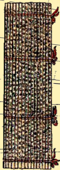
Письмо на бамбуковых дощечках