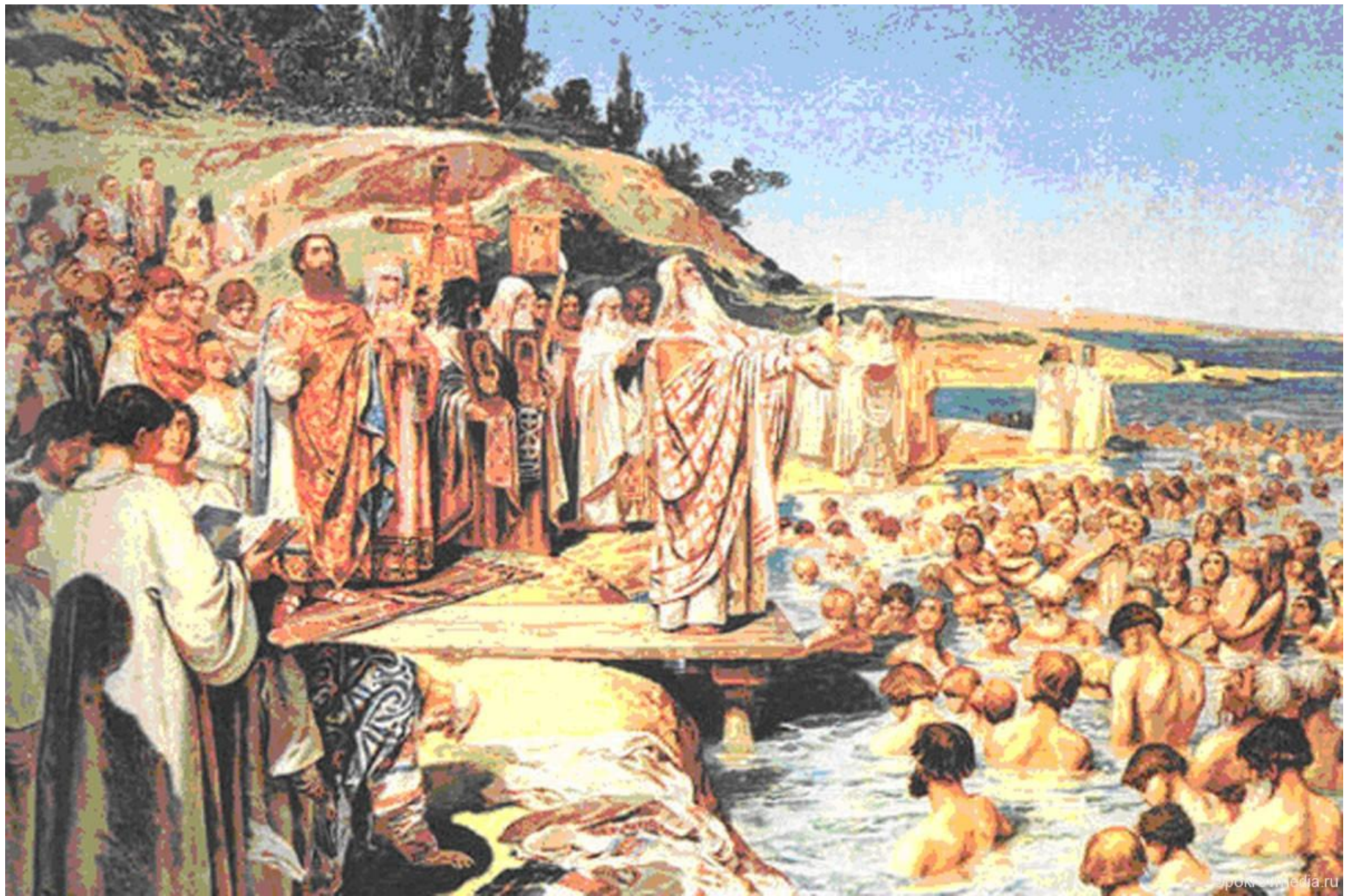
Крещение киевлян в Днепре