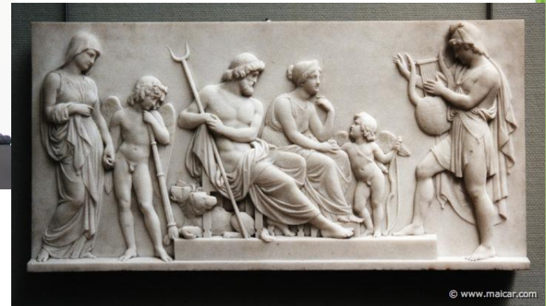
Орфей, играющий для Аида и Персефоны.