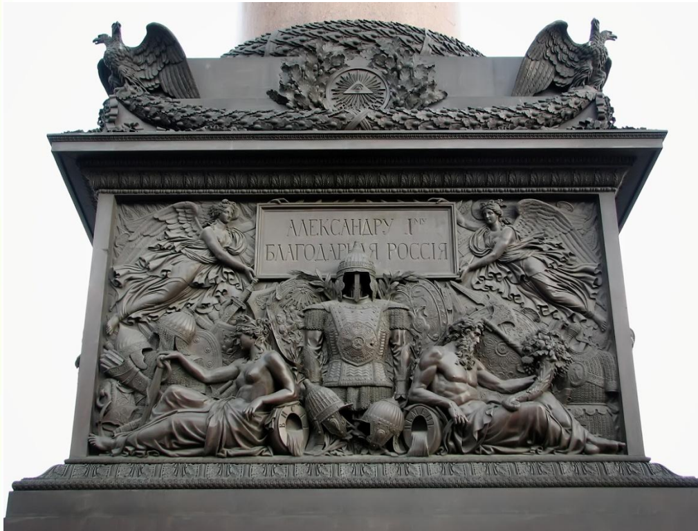
Барельеф пьедестала Александровской колонны.