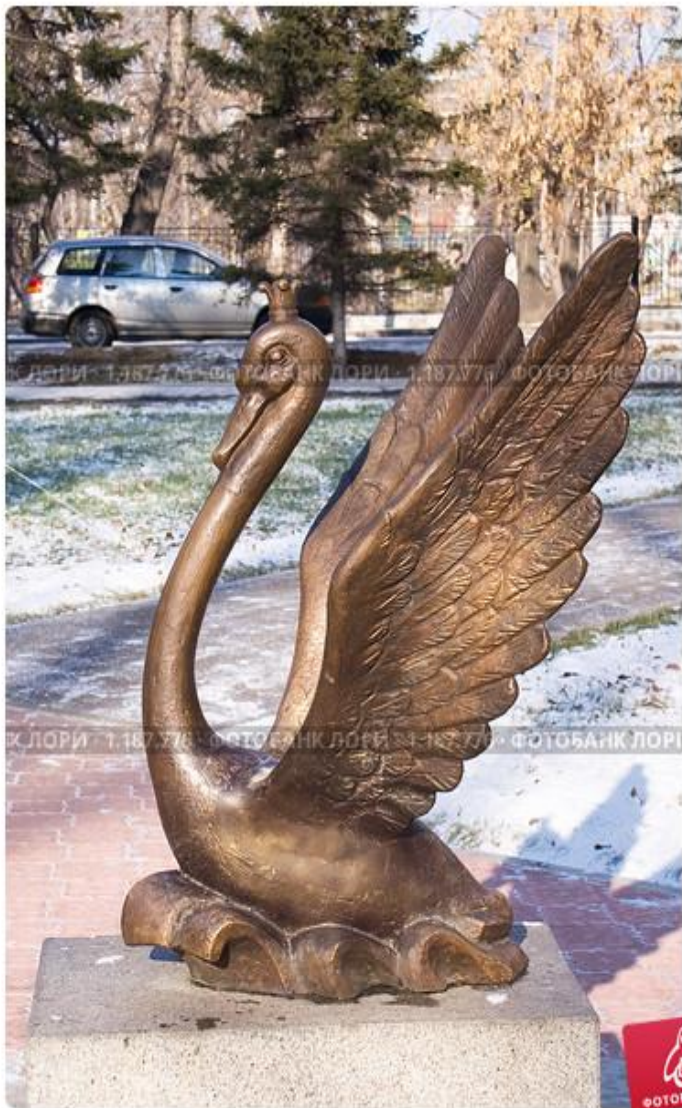
Бронзовая скульптура Царевны-Лебедь