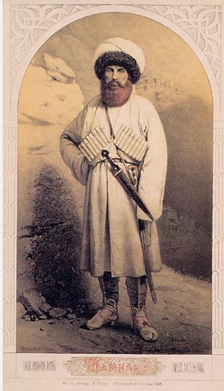
Рис. А. С. Торова