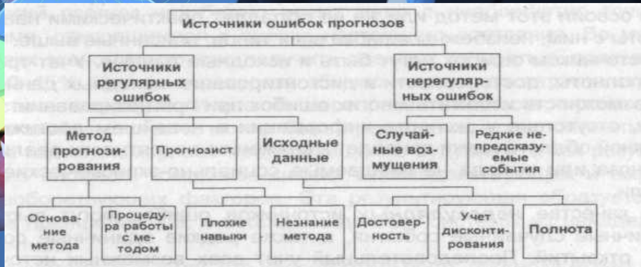
Рис. Классификация источников ошибок.

7. Верификация минимизацией систематических ошибок - этот метод состоит в проверке учета источников систематических ошибок в процессе разработки прогнозов. Для реализации данного метода нужно располагать классификацией источников ошибок (см. рис.).