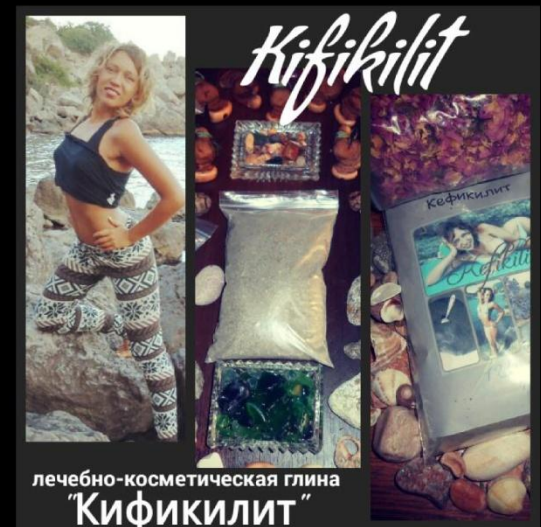
лечебно-косметическая глина "Кификилит"