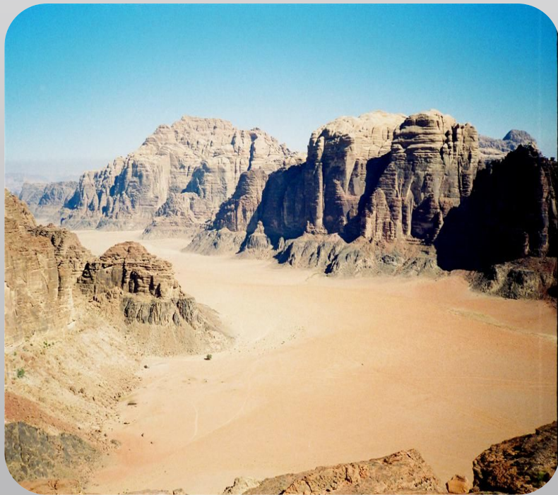
Крупнейшая пустыня Руб-эль-Хали

Находятся к востоку от Каспийского моря, на нагорьях Передней Азии и Аравийского полуострова . Природа зоны тропических пустынь напоминает природу пустынь Северной Африки. Характеризуются малым количеством осадков (до 100 мм), значительной амплитудой суточных t . Из растительности особенно много эфемеров , которые за период коротких весенних дождей успевают пройти весь цикл развития (солянка, полынь, акация, верблюжья колючка). Из животных здесь обитают пустынная кошка, газели, гиены, шакалы, много пресмыкающихся.