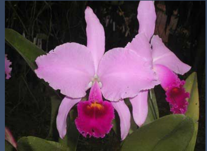
Орхидея Cattleya trianae