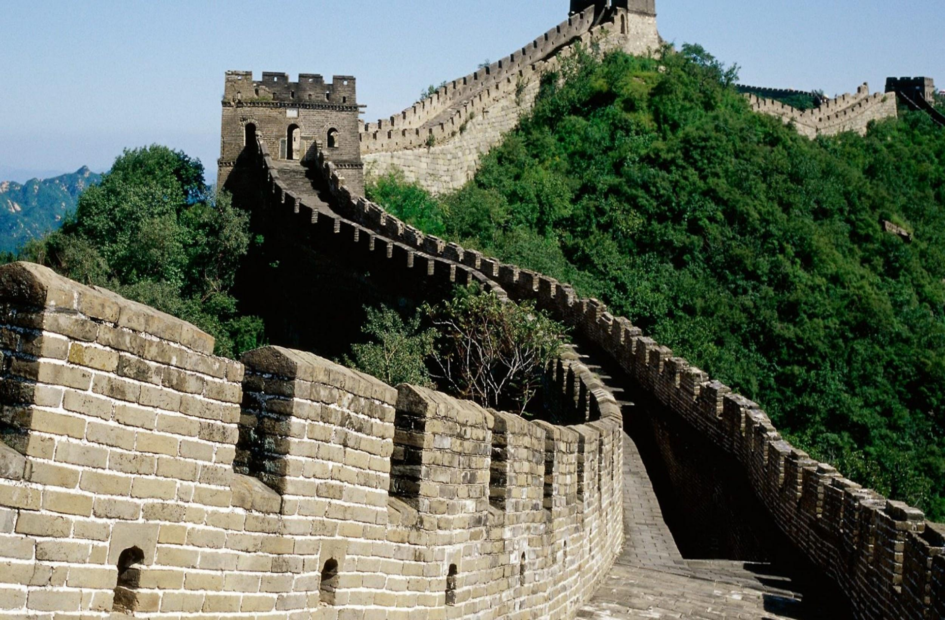
Великая Китайская стена