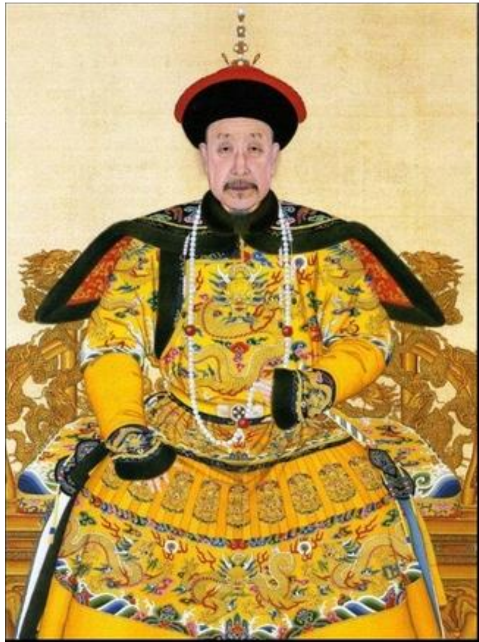
Император Древнего Китая