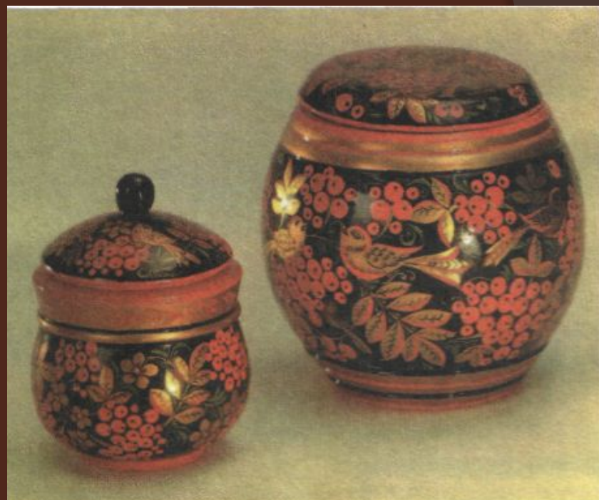
Е. Мосина. Хохломская посуда

Уже в XVII веке в селе Хохлома проходили ярмарки, где торговали деревянной расписной посудой, изготовленной в селах и деревнях Нижегородского края.