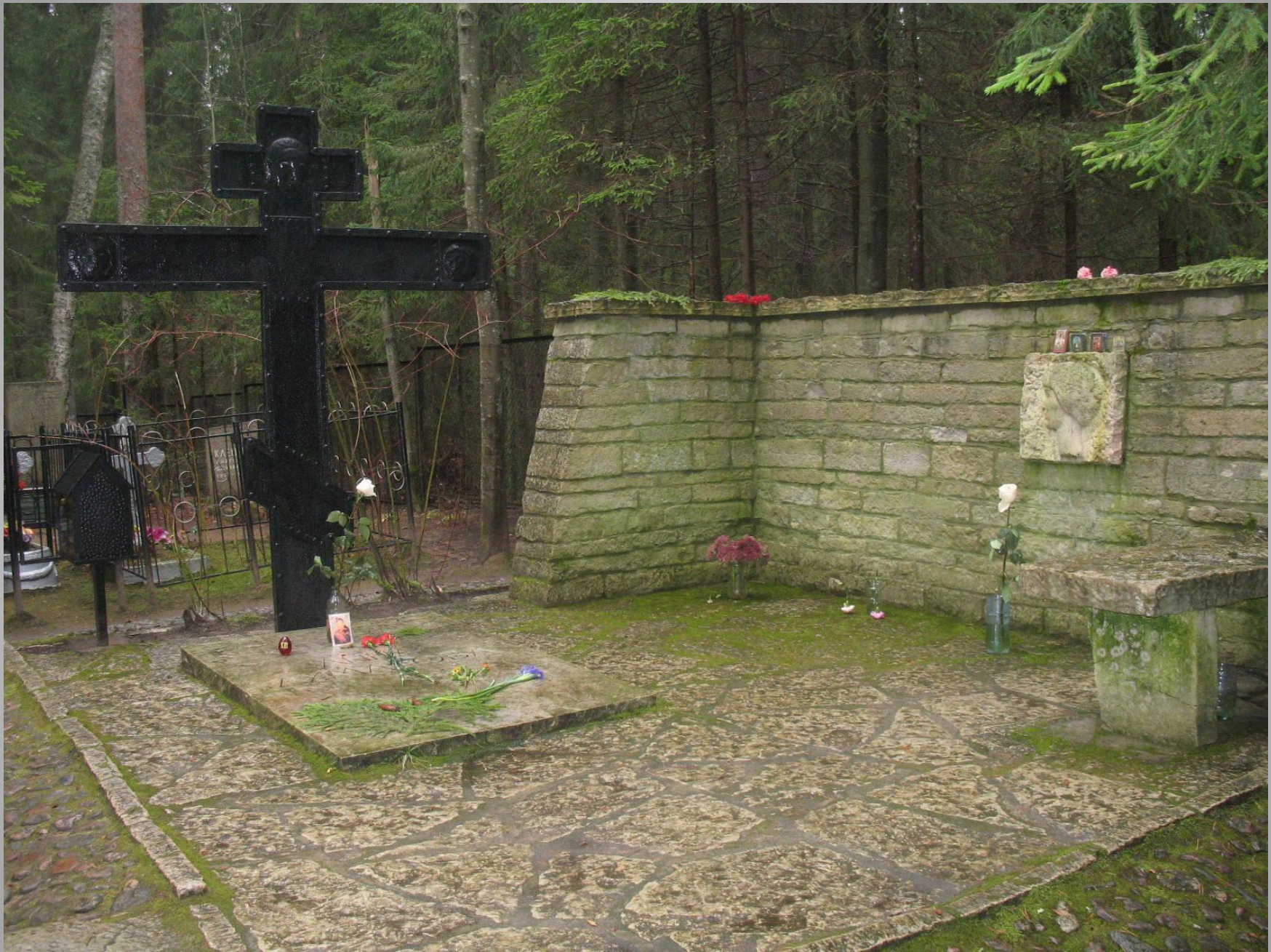
Могила А.А. Ахматовой в Комарово