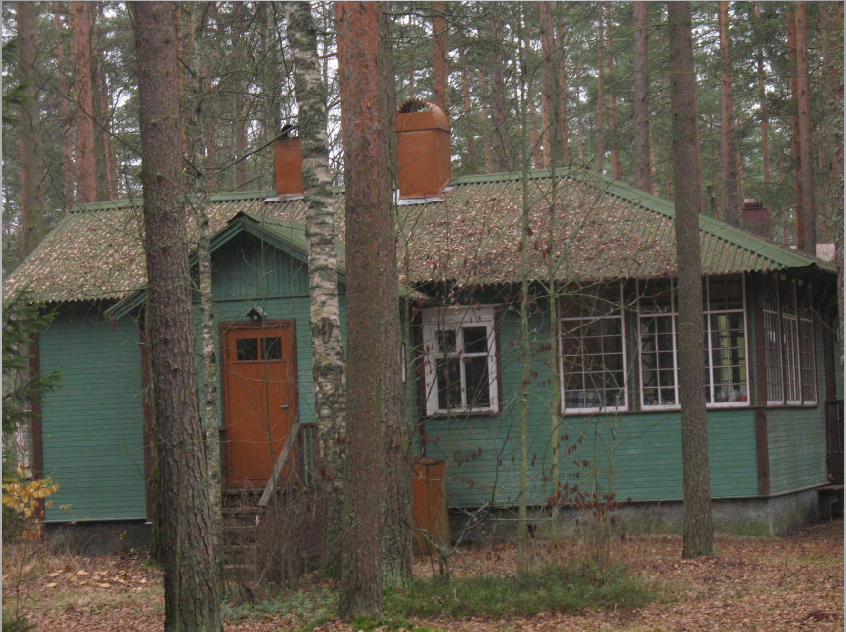
Дачный поселок Комарово. Дом, в котором А.А. Ахматова жила в последние годы.