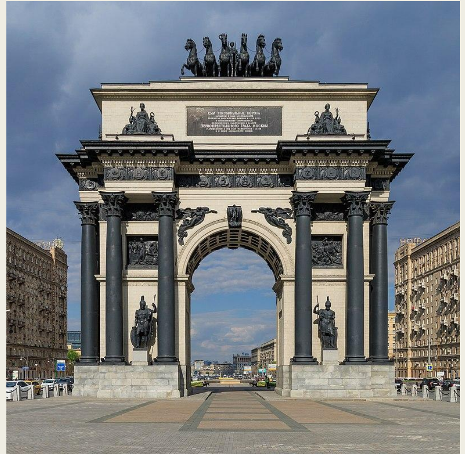
Триумфальные ворота (Москва). 1829-1834. Проект О. И. Бове