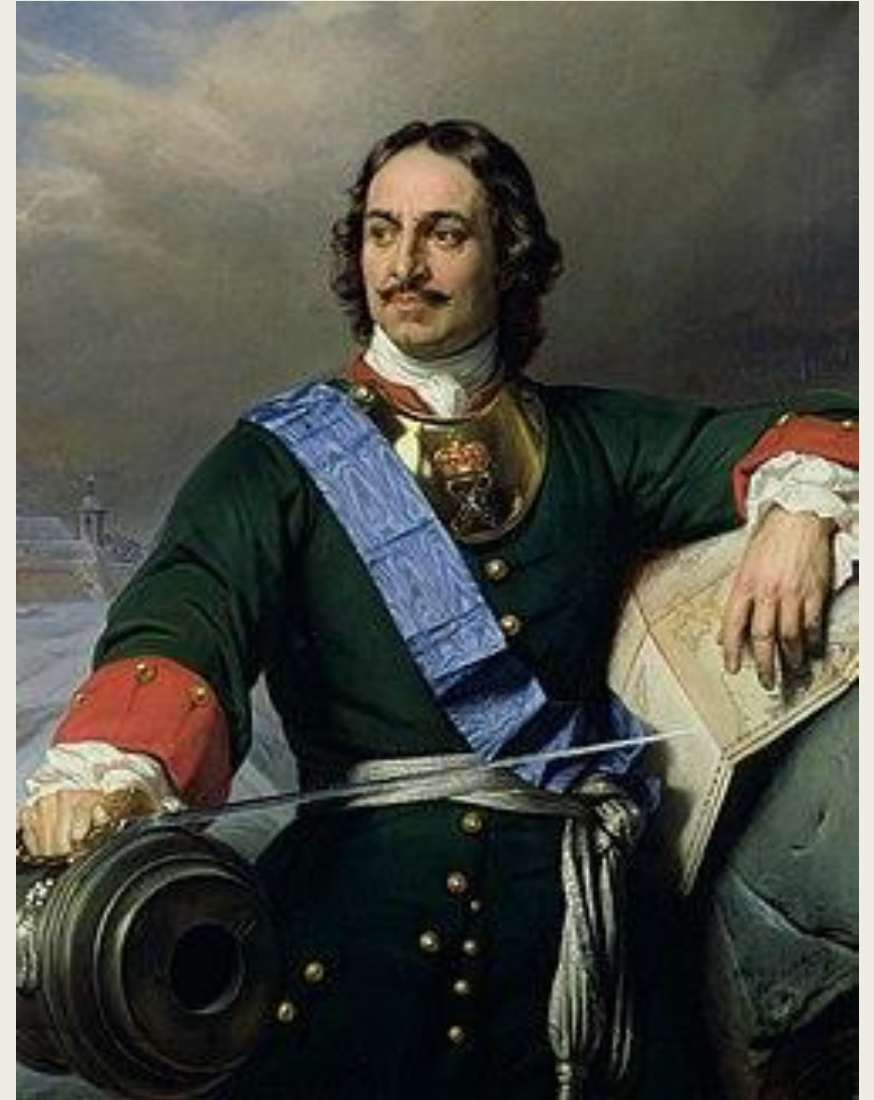
П. Деларош. Петр I Великий, император России. 1838. Гамбург, Кунстхалле