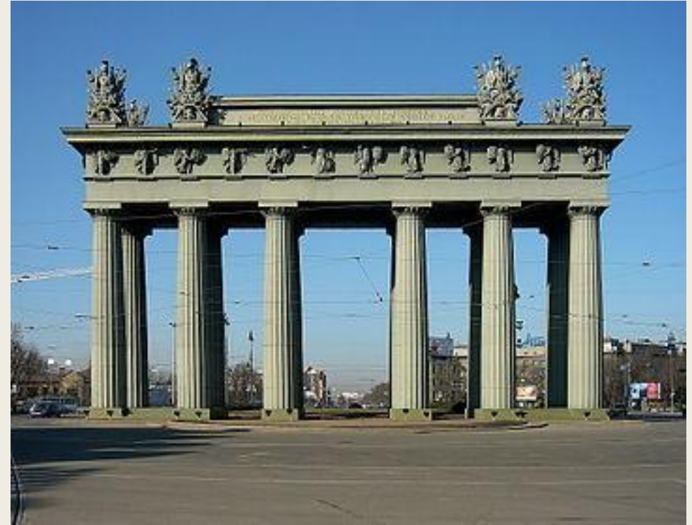
Московские Триумфальные ворота