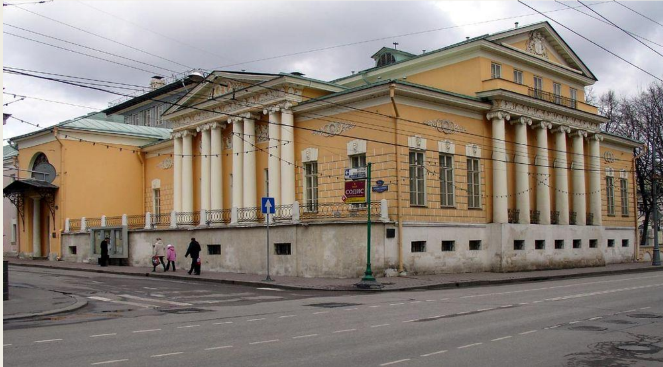
Уса́дба Хрущёвых — Селезнёвых — усадьба в стиле ампир