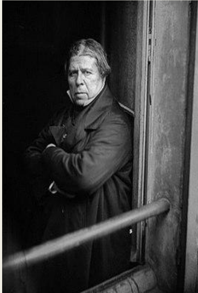
Жан Огюст Доменик Энгр