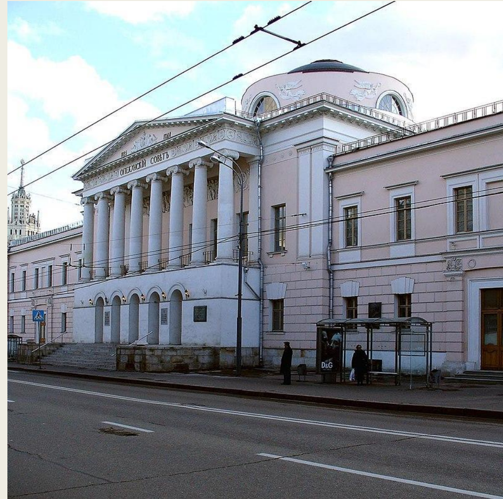
Опекунский совет на Солянке — стиле ампир