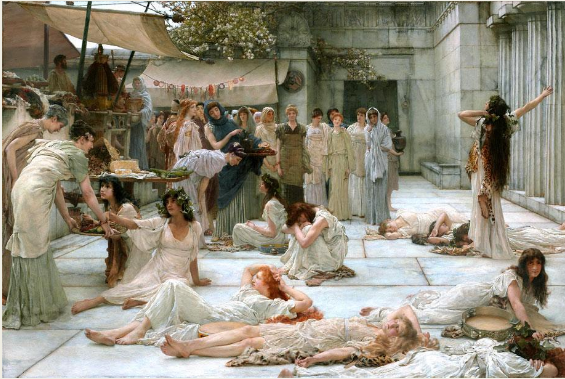
Женщины Амфисса " 1888 год.