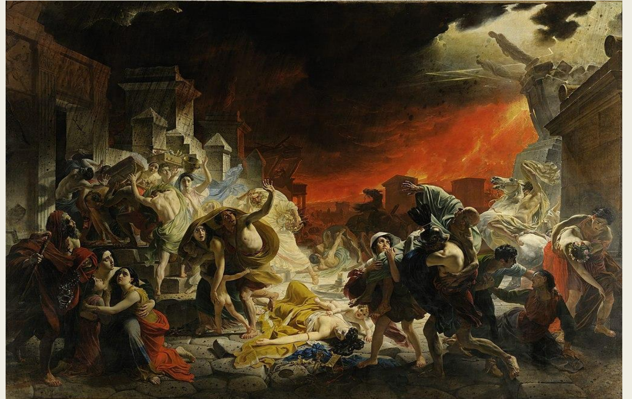
Последний день Помпеи, 1830—1833. Государственный Русский музей, Санкт-Петербург, Россия