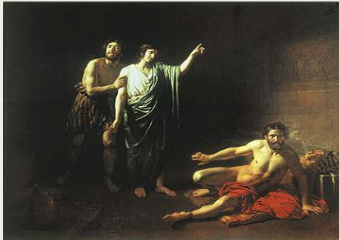
«Иосиф, толкующий сны заключенным с ним в темнице виночерпию и хлебодару» (1826)