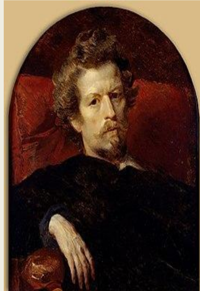
Карл Брюллов (автопортрет) (1848)