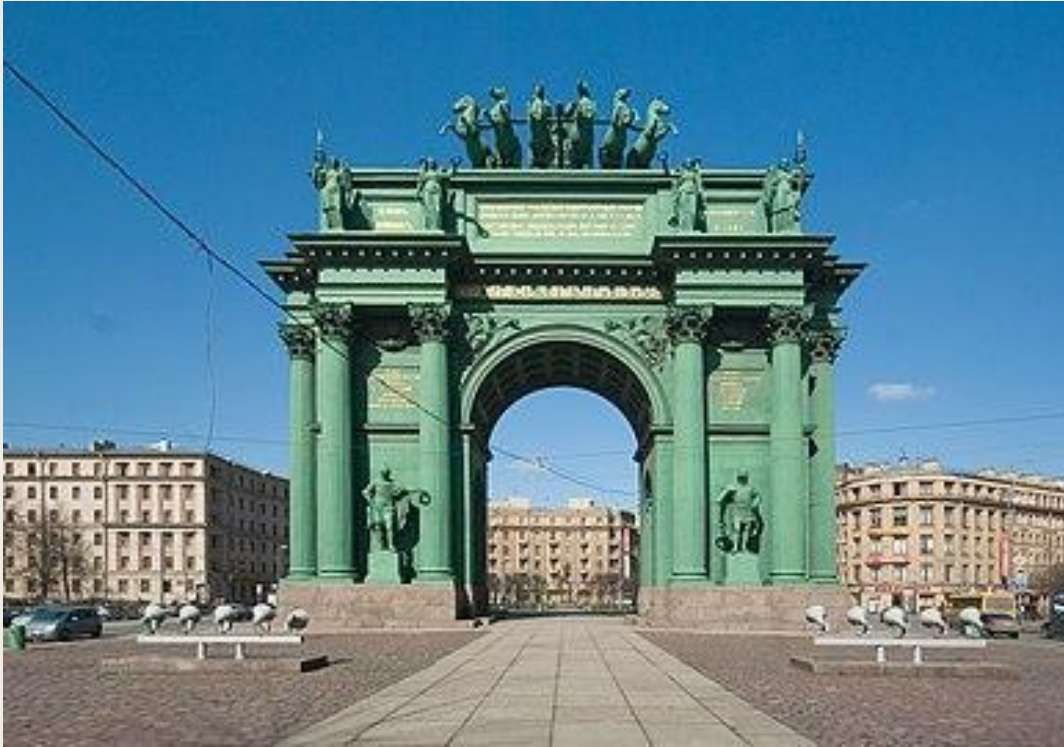
Нарвские триумфальные ворота