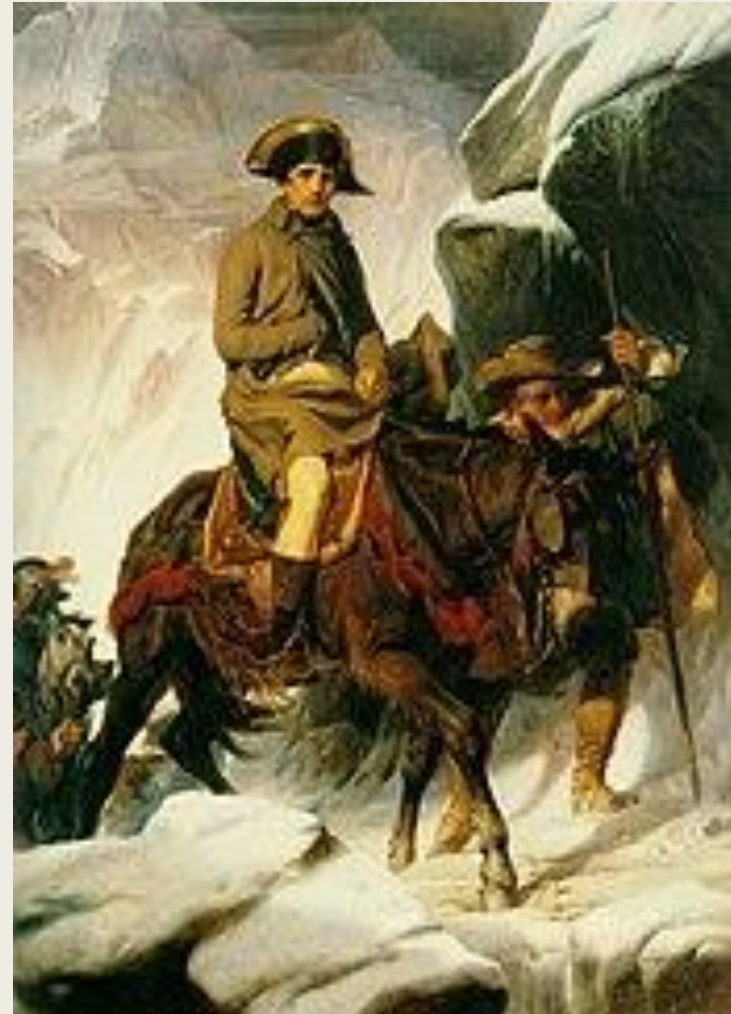
«Переход Наполеона через Альпы», Поль Деларош, 1848

Приняв за основу классическое античное наследие, эти академии сформулировали эстетическую доктрину классицизма, постепенно превратив ее в догму, в систему «вечных» канонов, отклонение от которых не допускалось. Именно в академиях была создана система художественного образования, обязательными элементами которого стал и рисунок, анатомия, композиция . Постепенно академии становятся оплотом консерватизма в искусстве.