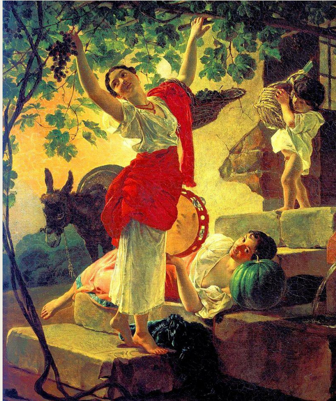
Девушка, собирающая виноград в окрестностях Неаполя, 1827. Государственный Русский музей, Санкт-Петербург, Россия.