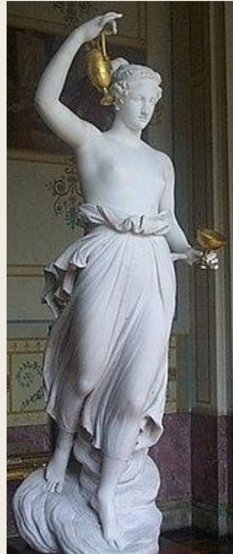
А. Канова. Геба. Ок. 1804. Мрамор. Государственный Эрмитаж, Санкт- Петербург