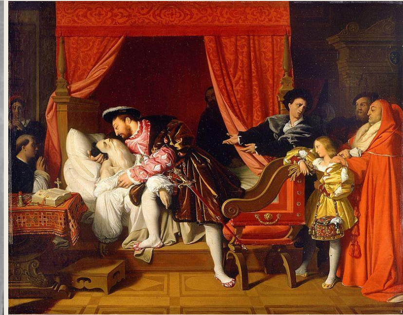
Франциск I при смерти Леонардо да Винчи, 1818, Париж, Музей Пти-Пале