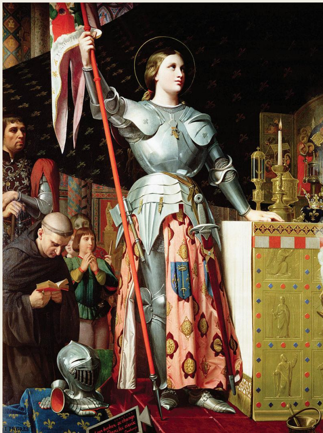
«Жанна д'Арк на коронации Карла VII», Жан Энгр, 1854