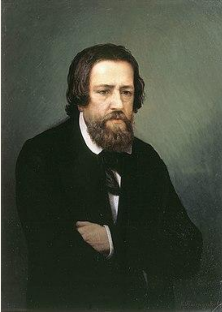
Александр Андреевич Иванов (Автопортрет)