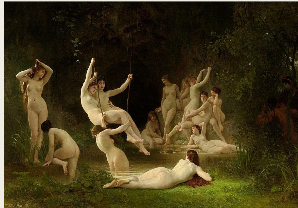
«Нимфы», Вильям Бугро, 1878