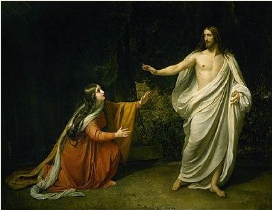
«Явление Христа Марии Магдалине после воскресения» (1835)