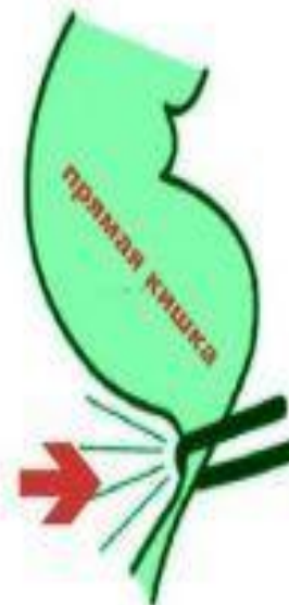
аноректальный угол прямой или острый