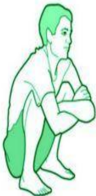
Поза орла запор победит