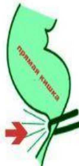
аноректальный угол прямой или острый