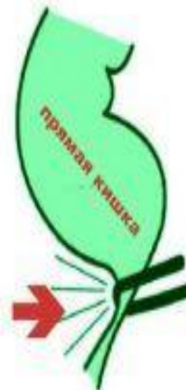
аноректальный угол прямой или острый