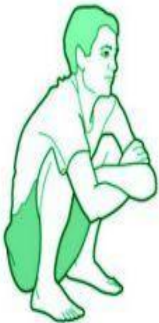
Поза орла запор победит