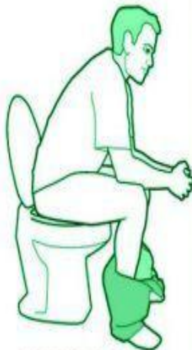
сидячее положение усугубляет запор