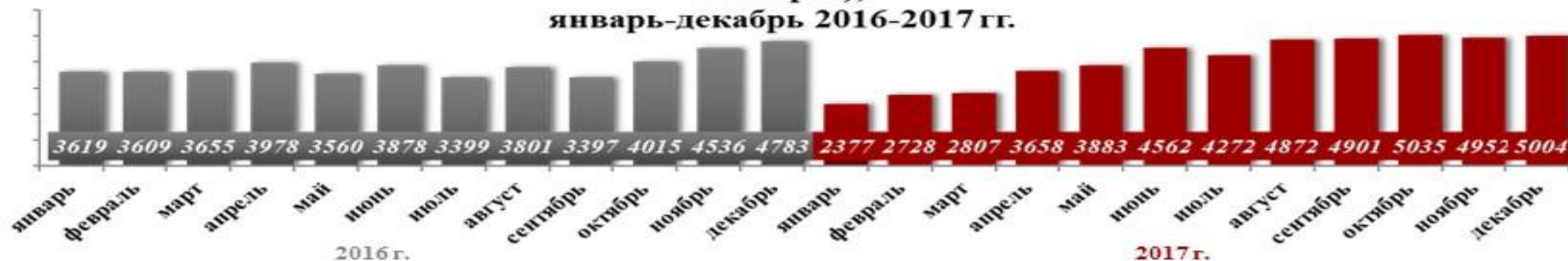
Динамика официальных продаж новых автомобилей в РК (без учета экспорта), январь-декабрь 2016-2017 гг.