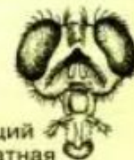
Лижущий (комнатная муха)