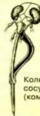
Колюще- сосущий (комар)