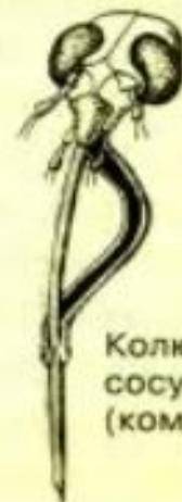
Колюще- сосущий (комар)