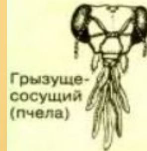
Грызуще- сосущий (пчела)