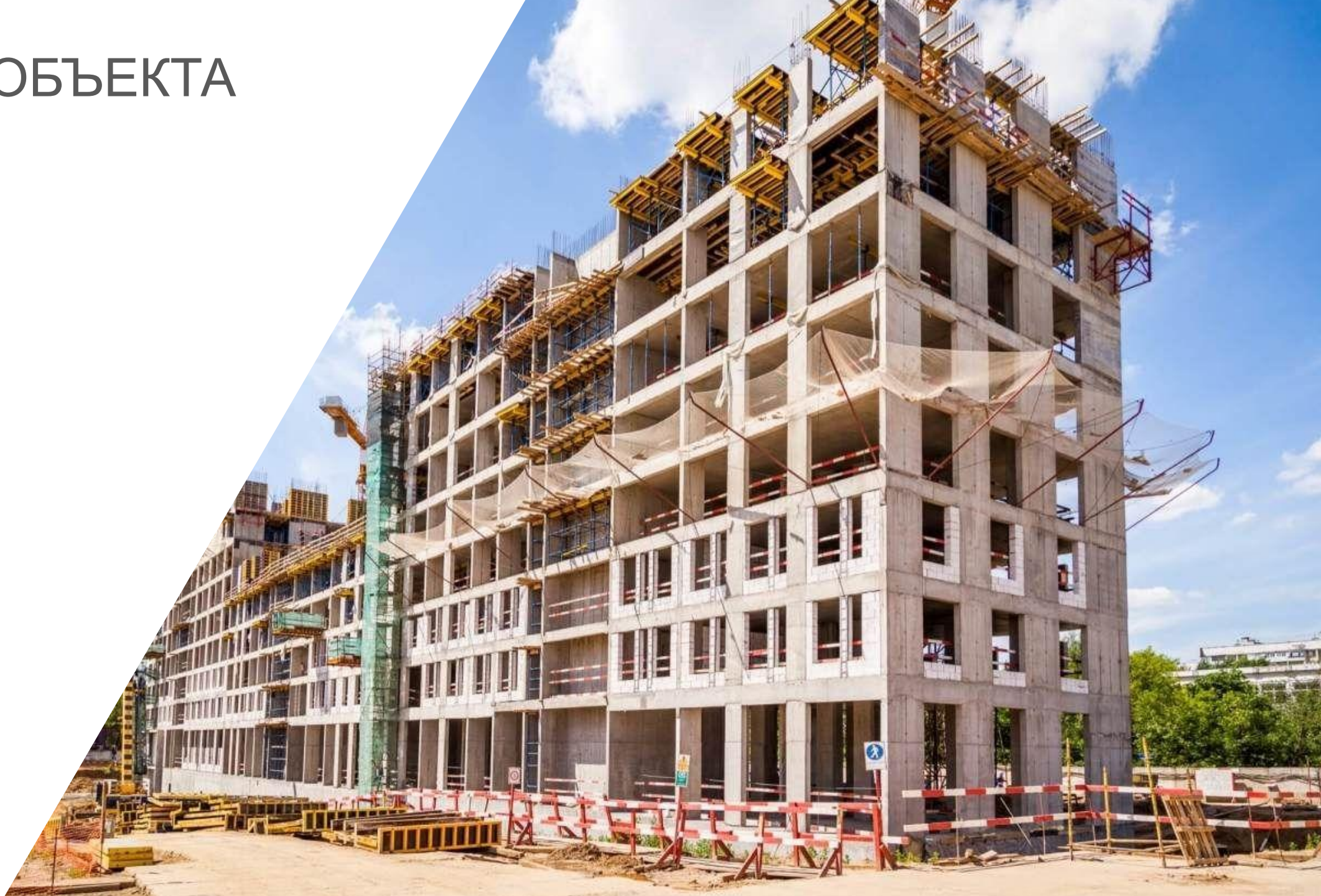
ФОТО С ОБЪЕКТА