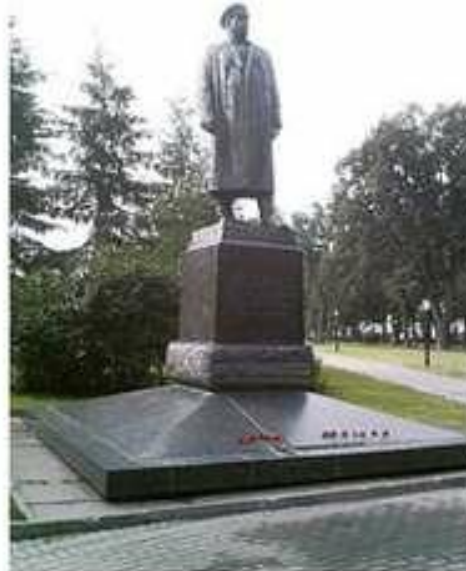
Пам'ятник Ф.Толбухіну в Москві