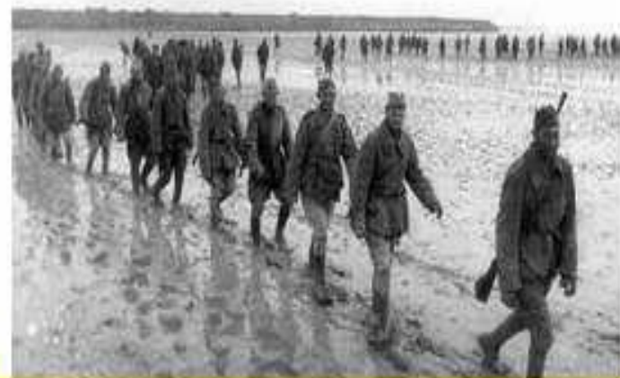
Солдати Четвертого Українського переходять Сиваш