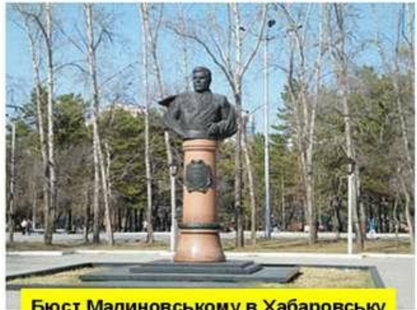
Бюст Малиновському в Хабаровську