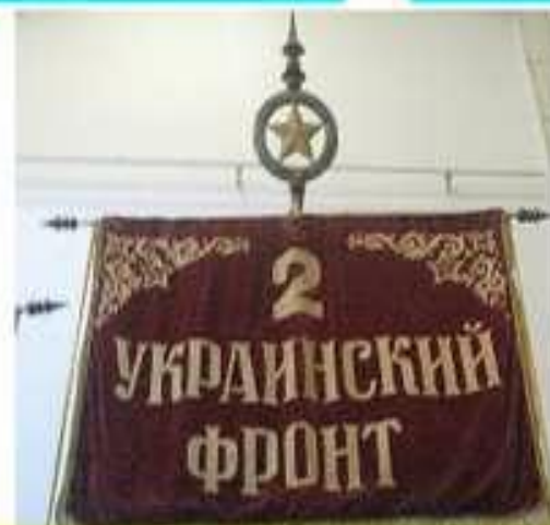
Прапор 2-го Українського фронту