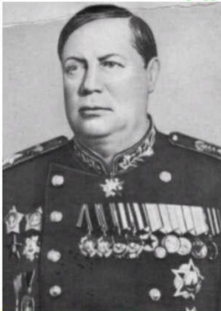
Федір Толбухін – командуючий IV Українським фронтом