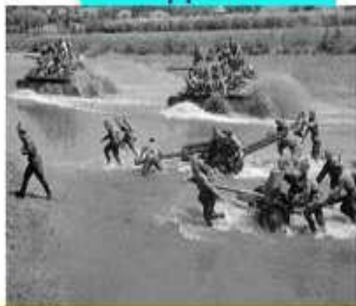
. 1-й український фронт. Літо 1944 року