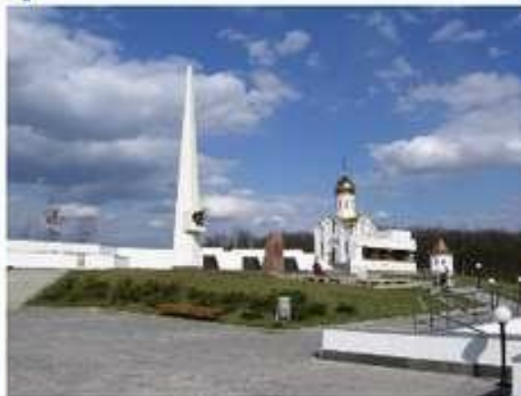
Меморіальний комплекс «Висота Конєва» в Харківській області