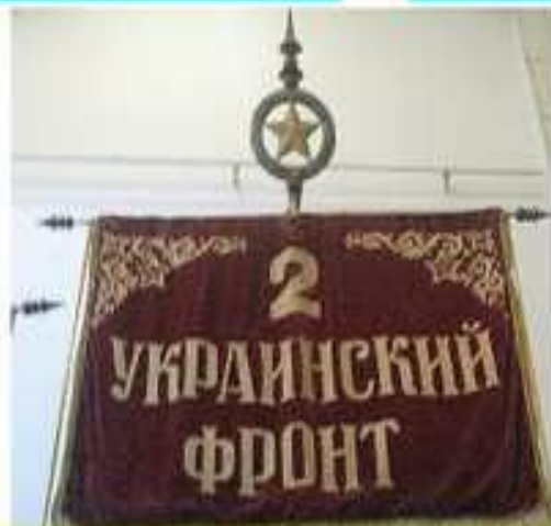
Прапор 2-го Українського фронту