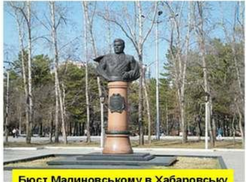
Бюст Малиновському в Хабаровську