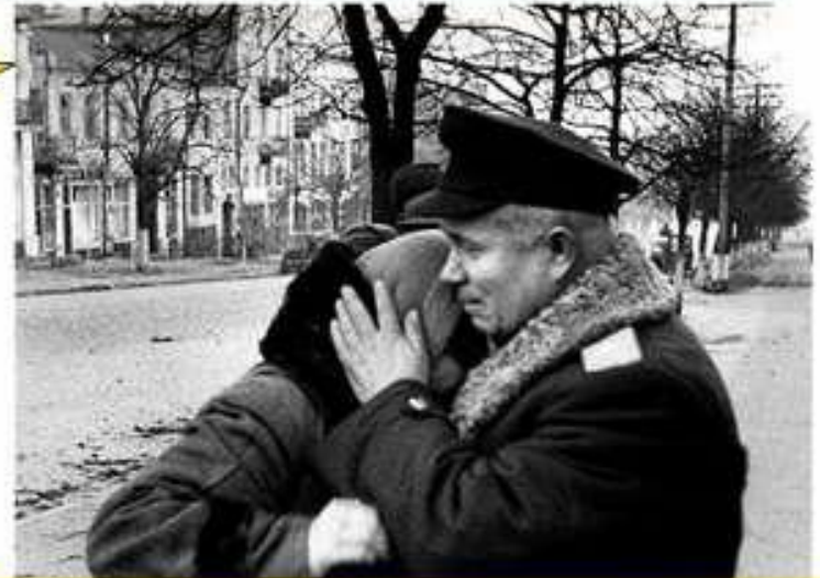
Хрущов утішає жінку на вулиці звільненого Києва у листопаді 1943 р.