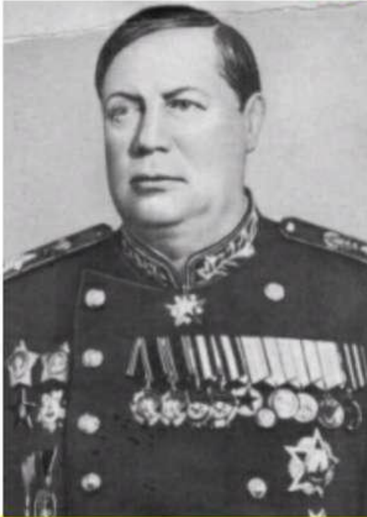
Федір Толбухін - командуючий IV Українським фронтом