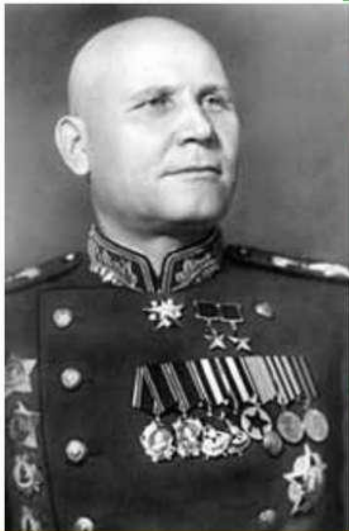
Іван Конєв – командуючий II Українським фронтом