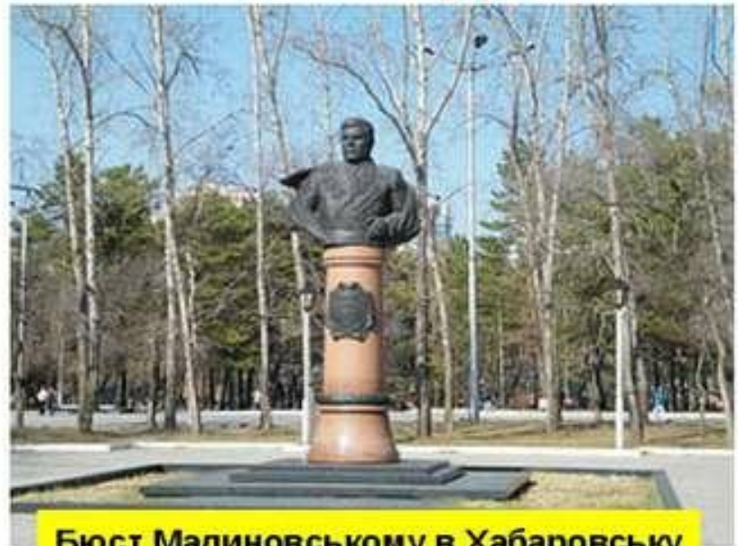
Бюст Малиновському в Хабаровську

Родіон Малиновський – командуючий III Українським фронтом