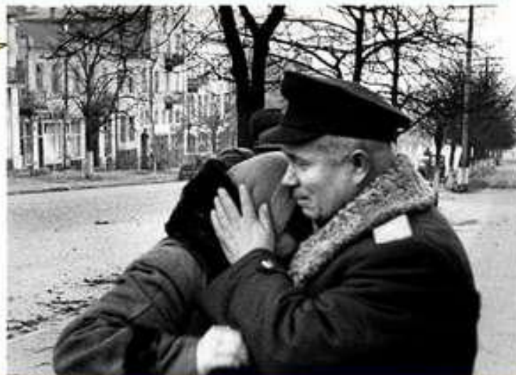
Хрущов утішає жінку на вулиці звільненого Києва у листопаді 1943 р.