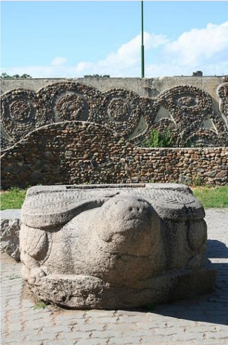
Чжурчжэньская каменная черепаха в городском парке Уссурийска