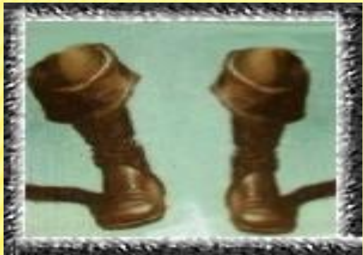
«Кот в сапогах»