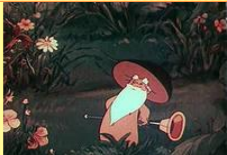
«Дудочка и кувшинчик»