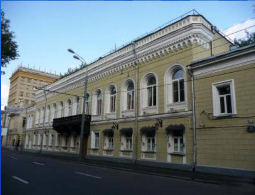
Здание музея Шахмат на Гоголевском бульваре