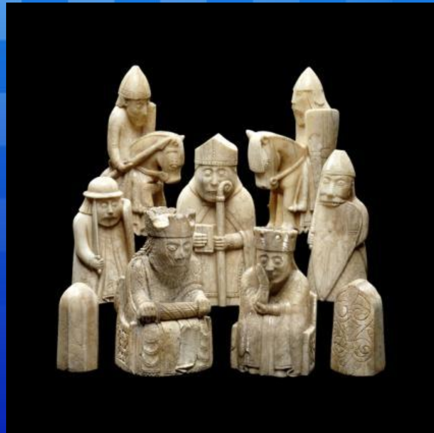
Шахматы с острова Льюис XII века.