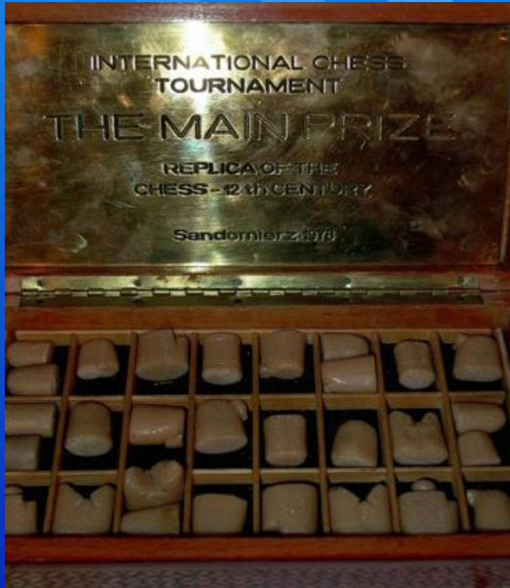
Копия самых древних шахматных фигур. Кость