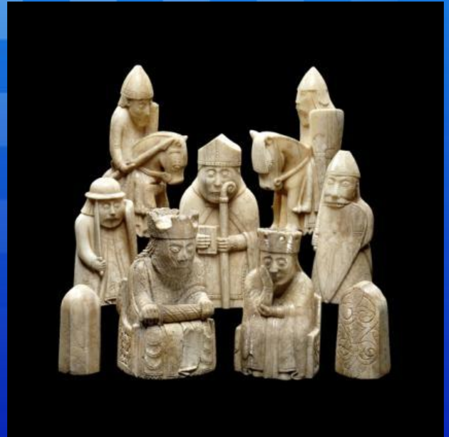
Шахматы с острова Льюис XII века.