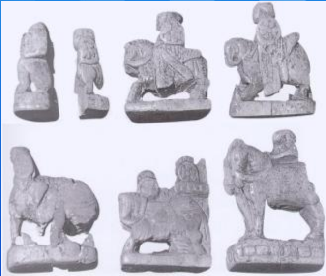
Шахматы из Самарканда VII век н.э.