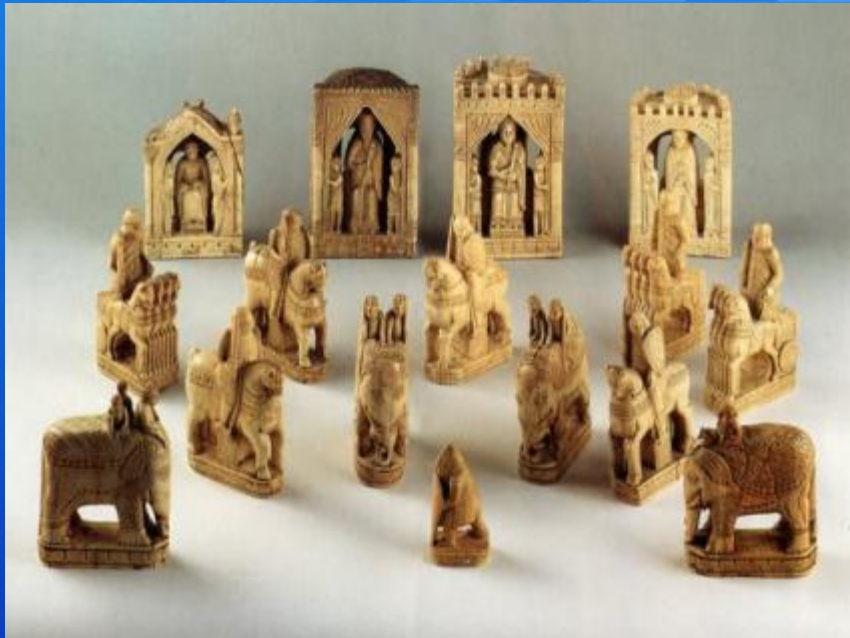
Шахматы Карла Великого XI век.