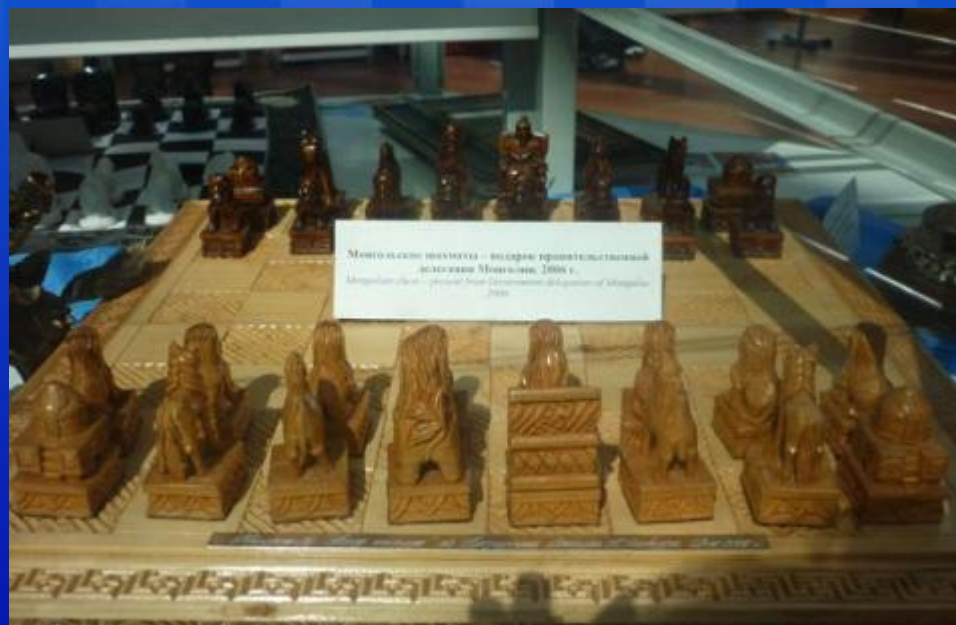
Мини-королевский шахматы - автор: профессорский институт Минского, 2008 г. Miniature chess - original from International Department of Chess 2008