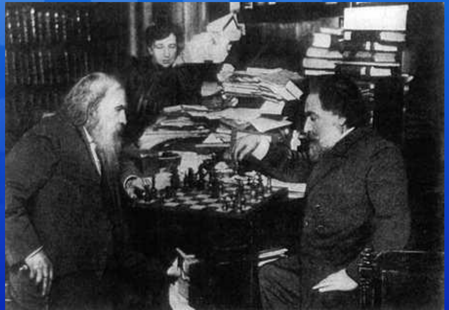
Д.И.Менделеев играет в шахматы с художником А.И.Куинджи. Фотография 1882 г.