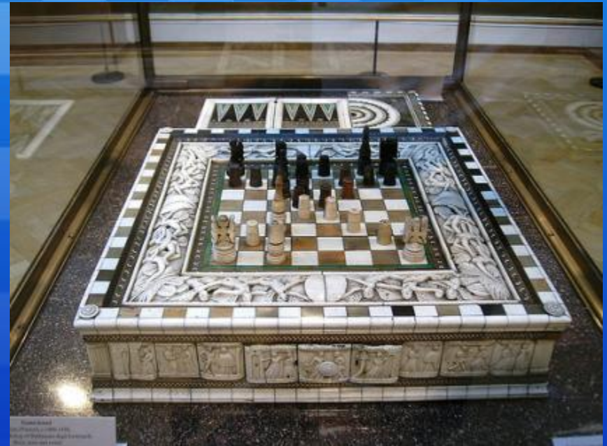
Шахматы Балдассаре Эмбриаччи. Оксфордский музей.