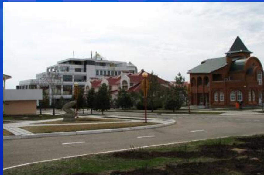
Площадь Каиссы – покровительнице шахмат