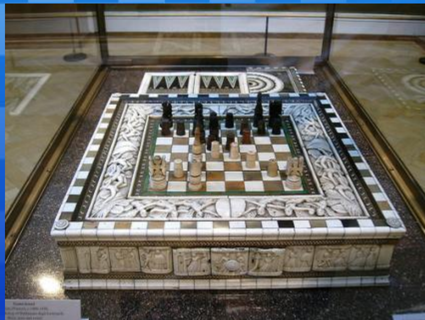
Шахматы Балдассаре Эмбриаччи. Оксфордский музей.