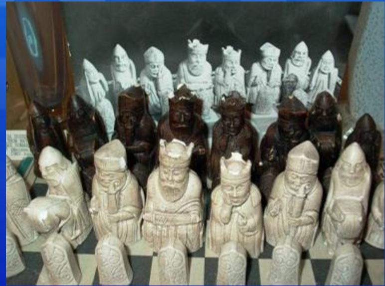
Старинные шахматы Викингов