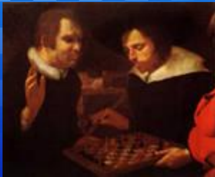
Бен Джонсон и Уильям Шекспир