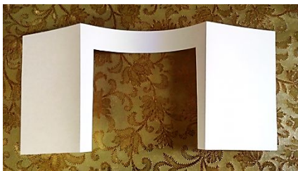
Портал с «зеркалом сцены»