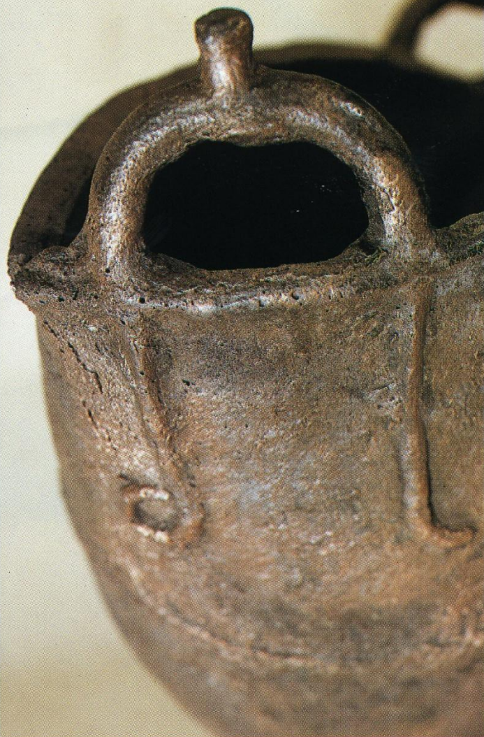
Бронзовый котел на поллой ножке. Курган 20 у с. Дуровка