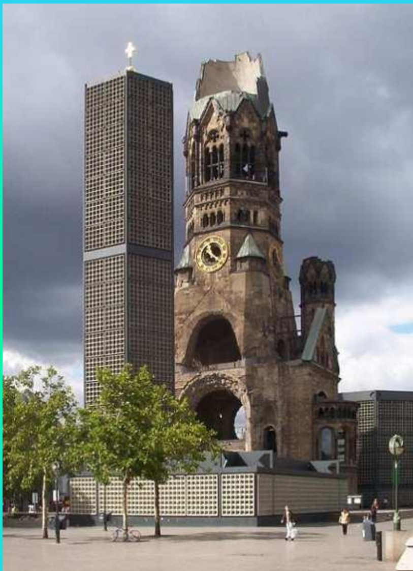
Мемориальная церковь кайзера Вильгельма, Берлин