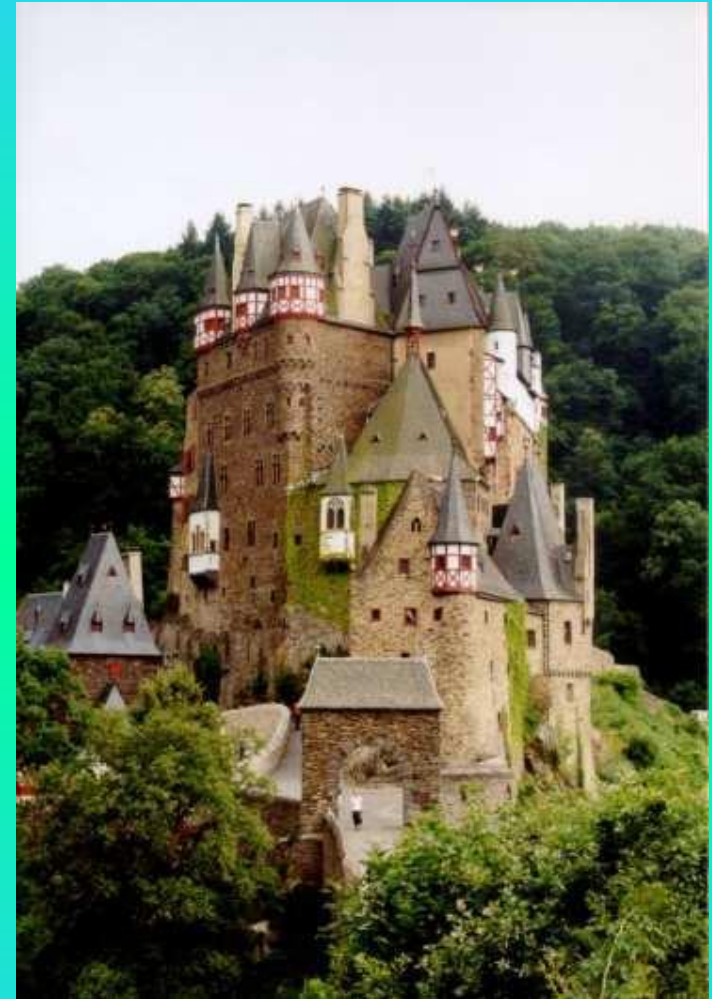
Замок Эльц на Мозеле (Рейнланд-Пфальц)