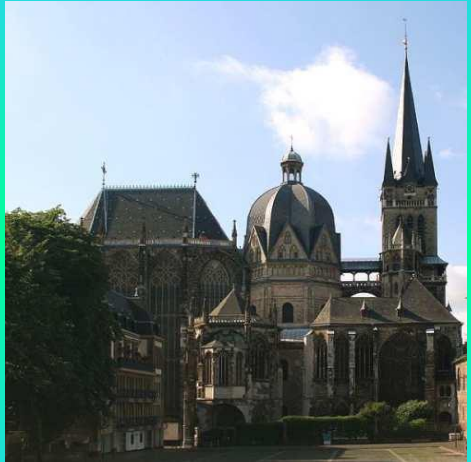
Аахенский собор, Аахен (Северный Рейн — Вестфалия)