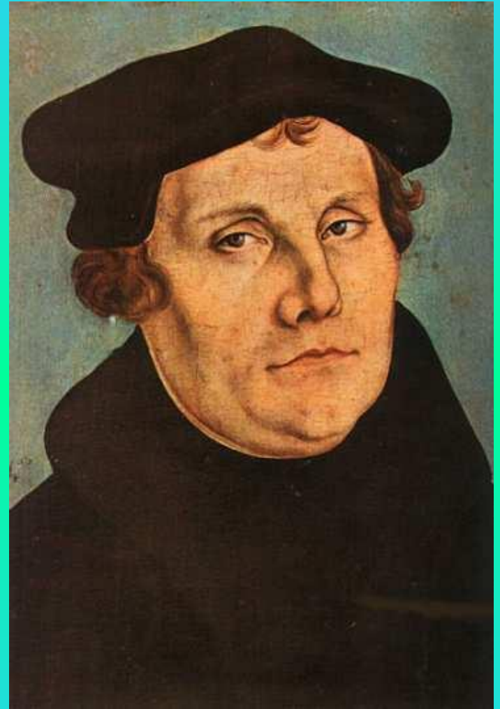
Мартин Лютер — основатель немецкого протестантизма (лютеранства)

Небольшая часть верующих принадлежит к христианским деноминациям — баптисты, методисты, верующие Новоапостольской Церкви и приверженцы других религиозных течений.