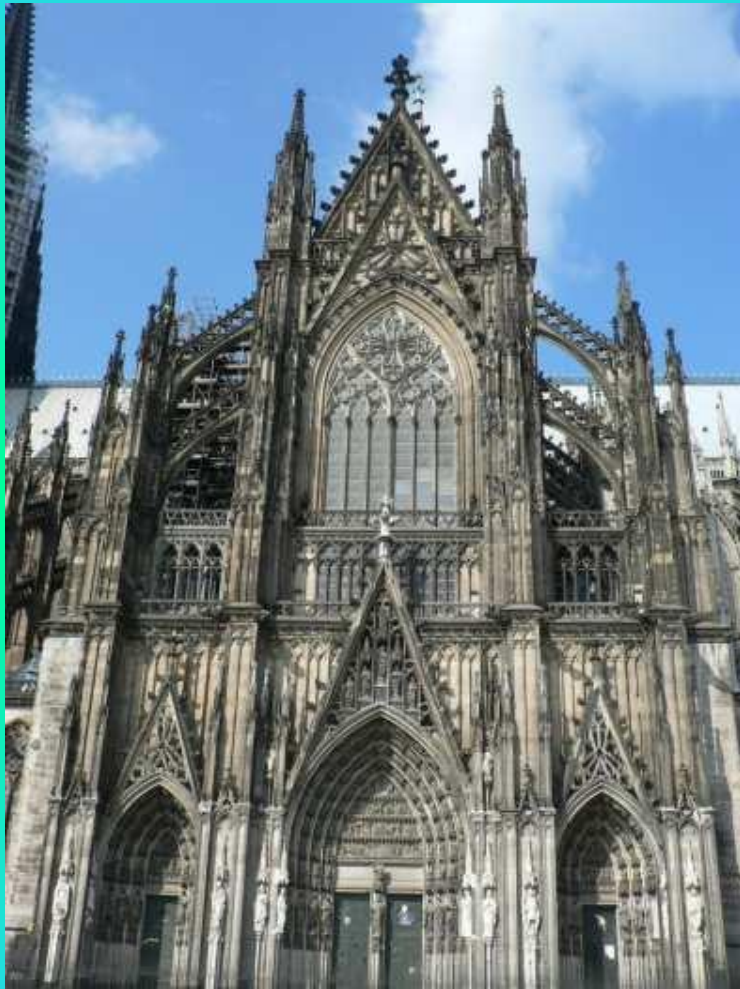
Кёльнский собор, Кёльн (Северный Рейн — Вестфалия)