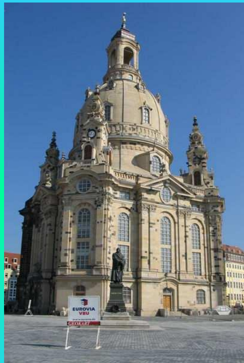
Фрауэнкирхе, Дрезден (Саксония)