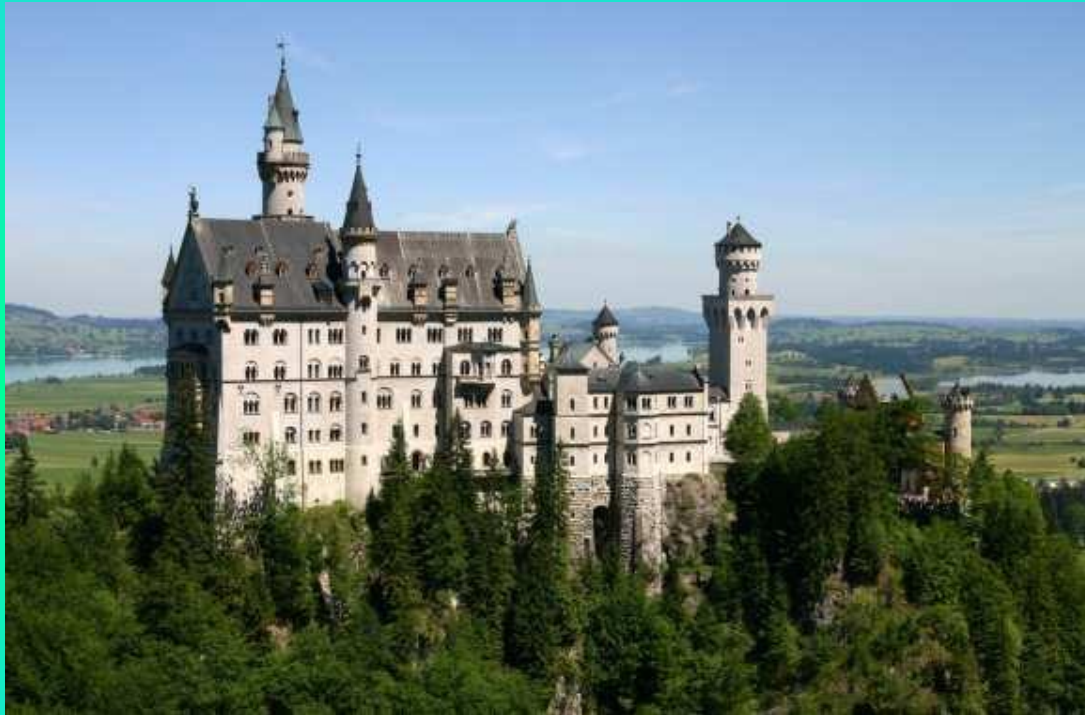
Королевский замок Нойшванштайн (Бавария)