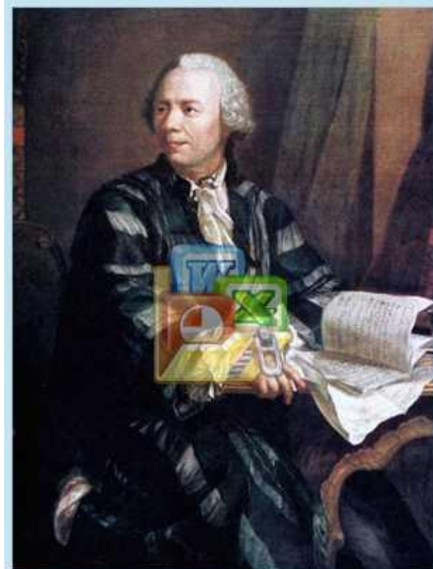
Леонард Эйлер (Leonhard Euler)

Задачу нахождения корней возвратного уравнения сводят к задаче нахождения решений алгебраического уравнения меньшей степени. Термин возвратные уравнения был введён Л. Эйлером.